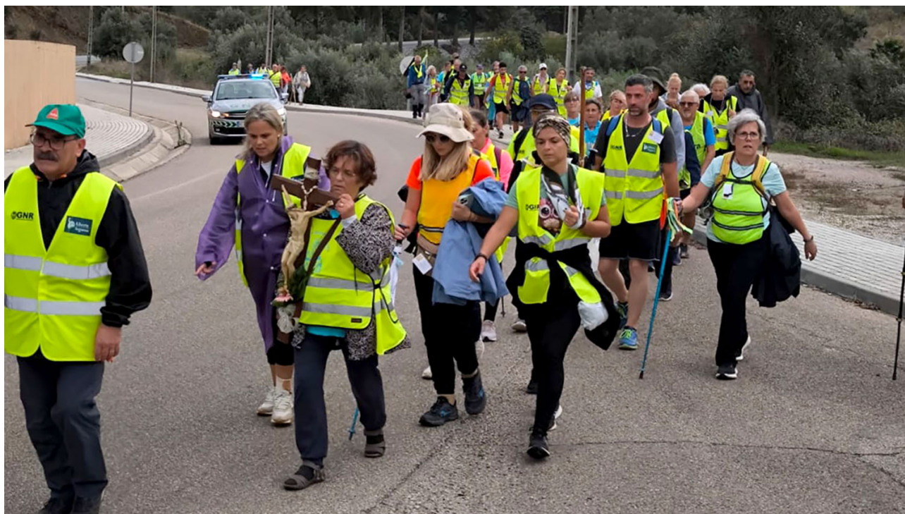
O grupo “Peregrinação: o Retiro”, de Évora percorre 200 quilómetros a pé até Fátima.