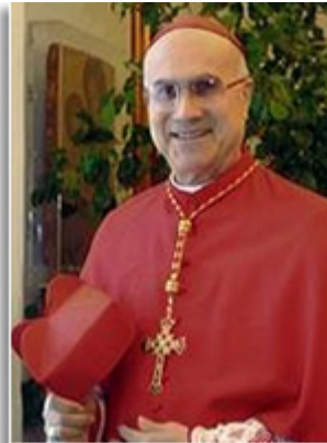
Card. Tarcisio Bertone

www.fatima.pt/pt/news/encerramento-90-anos-aparicoes