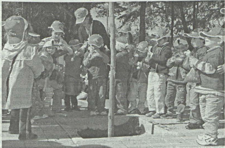
Cada criança trouxe um saco de terra para plantar a árvore.

O Santuário de Fátima, celebrou, no passado dia 19 de Março, com a antecipação de dois dias para a comunidade escolar poder estar presente, o Dia Mundial da Árvore.