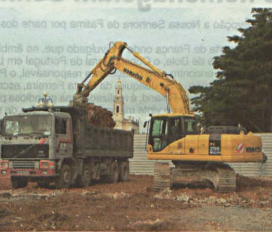
Está a nascer neste local a Nova Igreja do Santuário de Fátima.

A nossa esperança é que esta obra signifique um grande passo em frente no