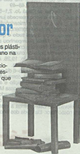
A escultura «Mestre da Beleza tão Antiga e tão Nova», de Irene Vilar, foi atribuído o prémio de aquisição.

Uma exposição a visitar, com entradas livres durante os próximos tempos.