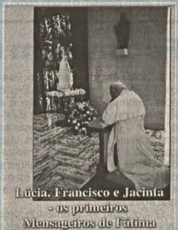
Lúcia, Francisco e Jacinta - os primeiros Mensageiros de Fátima

Nas dioceses onde ainda não há secretariado diocesano, podem requisitá-lo ao secretariado nacional do MMF - Santuário de Fátima - 2496-908 FÁTIMA CODEX.