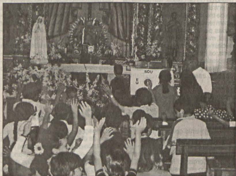
Crianças da Moimenta da Beira (Lamego), louvando a Jesus escondido.

Mais pormenores serão dados no próximo número da "Voz da Fátima".