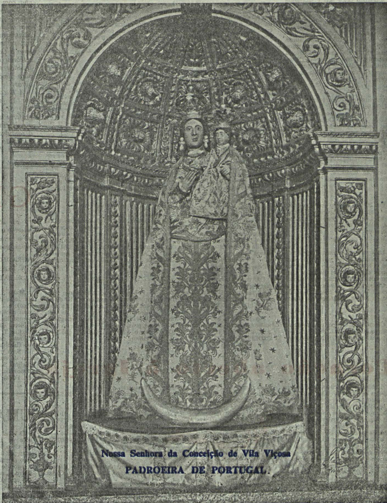
Nossa Senhora da Conceição de Vila Viçosa PADROEIRA DE PORTUGAL.

É por esta realidade que tem de começar a nossa presença junto dos irmãos alentejanos. Realidade que é uma tremenda interrogação e poderá ser também uma chave de interpretação para tudo o que se tem passado ultimamente nas terras trans-taganas. Porque lá não foi o urbanismo, nem o materialismo progressista que des-ertificou, colesialmente falando, aqueles enormes territórios. Nós vamos lá para