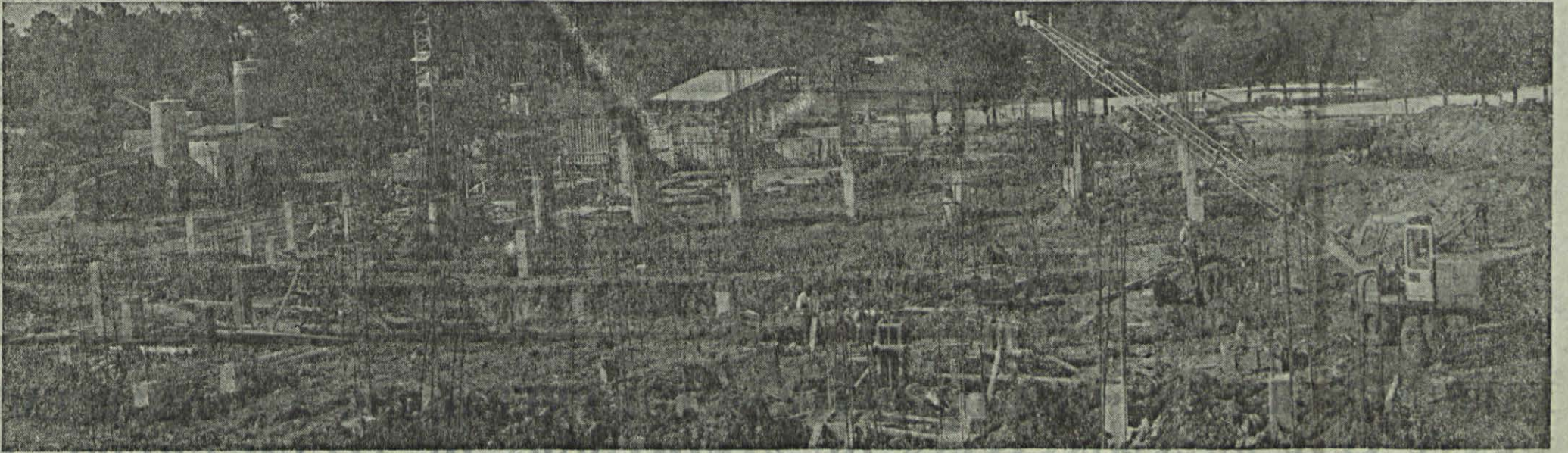
UM NOVO E IMPORTANTE EDIFÍCIO ESTÁ A SER CONSTRUÍDO NO PERÍMETRO DO SANTUÁRIO DE FÁTIMA. TRATA-SE DO CENTRO PASTORAL DE PAULO VI, CUJA PEDRA INAUGURAL FOI BENZIDA NO DIA 13 DE MAIO, DURANTE A GRANDE PEREGRINAÇÃO ANIVERSÁRIA.

Em próxima oportunidade «VOZ DA FÁTIMA» continuará historiando a acção desenvolvida pelo Santuário e pelos técnicos de engenharia até à adjudicação da empreitada de construção e continuaremos também dando conta do avanço das obras.