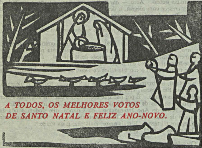
A TODOS, OS MELHORES VOTOS DE SANTO NATAL E FELIZ ANO-NOVO.

Entretanto, meditemos ao longo destas semanas e durante as férias, no mais importante acontecimento de toda a História: O NASCIMENTO DE JESUS!