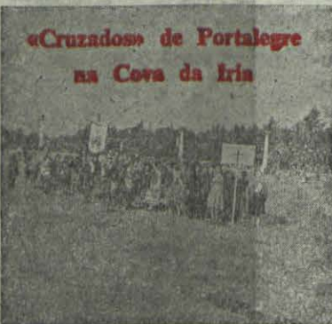
«Cruzados» de Portalegre na Cova da Iria