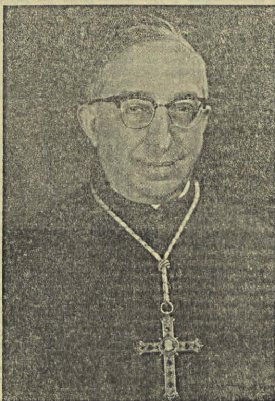
Sua Eminência o Senhor Cardeal Luigi Traglia, Pro-Vigário de Sua Santidade, que presidirá à Peregrinação de 12-13 de Maio