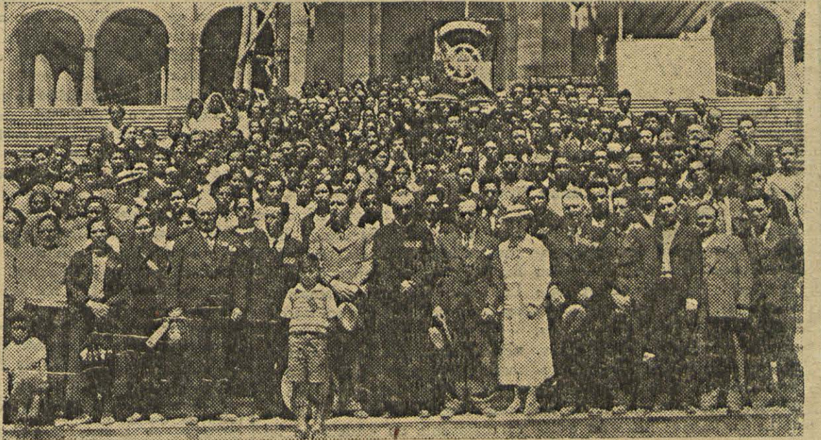
Fátima, 13 de Julho — A peregrinação da fábrica Barcelense