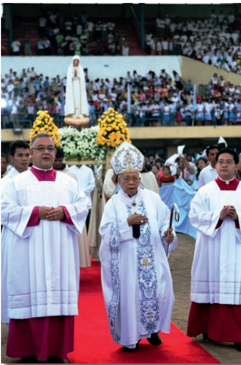
Figura nawiedziła dwadzieścia siedem filipińskich archidiecezji i diecezji. Matka Boska była w katedrach i kościołach parafialnych, a także kaplicach seminariów, szkół podstawowych i średnich oraz na uniwersytetach, w więzieniach, na poligonach policji i w szpitalach.

Głównym celem wizyty było wzbudzenie i wzmocnienie w filipińskich rodzinach nabożeństwa do Matki Boskiej Fatimskiej, dokonywane właśnie poprzez formację i upowszechnianie prawdziwego orędzia z Fatimy.