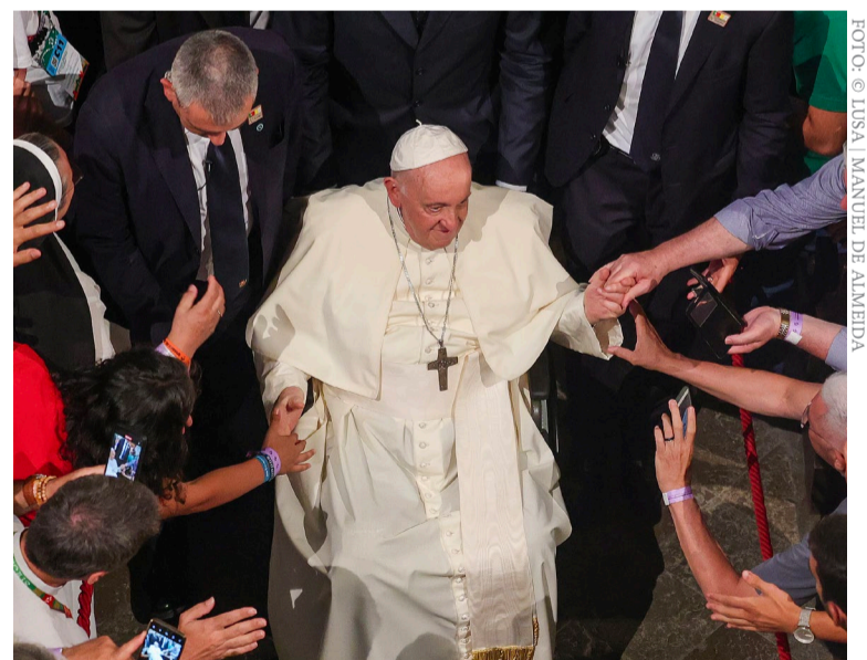
2 de agosto, Mosteiro dos Jerónimos

“Estou feliz por estar em Lisboa, cidade do encontro que abraça vários povos e culturas e que, nestes dias, se mostra ainda mais universal; torna-se, de certo modo, a capital do mundo, capital do futuro, porque os jovens são o futuro. Isto condiz bem com o seu caráter multiétnico e multicultural (penso, por exemplo, no bairro da Mouraria, onde convivem pessoas provenientes de mais de 60 países) e revela os traços cosmopolitas de Portugal (...) As grandes questões hoje, como sabemos, são globais e já muitas vezes tivemos de fazer experiência da ineficácia da nossa resposta às mesmas, precisamente porque o mundo, diante de problemas comuns, se mantém dividido ou pelo menos não suficientemente unido, incapaz de enfrentar juntos aquilo que nos põe em crise a todos”