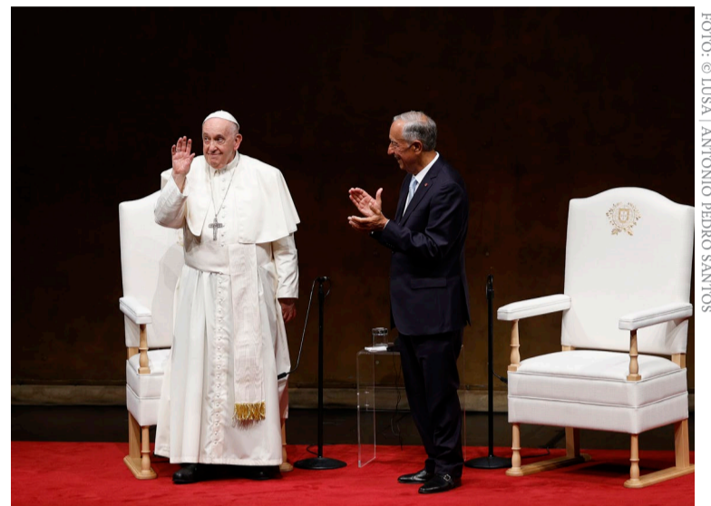
2 de agosto, Centro Cultural de Belém

“Sonho com uma Europa, coração do Ocidente, que use o seu engenho para apagar focos de guerra e acender luzes de esperança; uma Europa que saiba reencontrar o seu ânimo jovem, sonhando a grandeza do conjunto e indo além das necessidades imediatas; uma Europa que inclua povos e pessoas, sem correr atrás de teorias e colonizações ideológicas(...) Espero que a Jornada Mundial da Juventude seja, para o velho continente, um impulso de abertura universal. Na verdade, o mundo tem necessidade da Europa, da Europa verdadeira: precisa do seu papel de construtora de pontes e de pacificadora no Leste europeu, no Mediterrâneo, na África e no Médio Oriente”