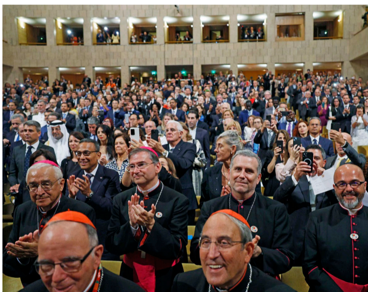
2 de agosto, Centro Cultural de Belém

“Rezei a Nossa Senhora e rezei pela paz. Não fiz propaganda. Mas rezei. E devemos continuamente repetir esta oração pela paz. Ela, na Primeira Guerra Mundial, tinha pedido isto. E eu, desta vez, isto pedi a Nossa Senhora. Rezei. Não fiz publicidade”