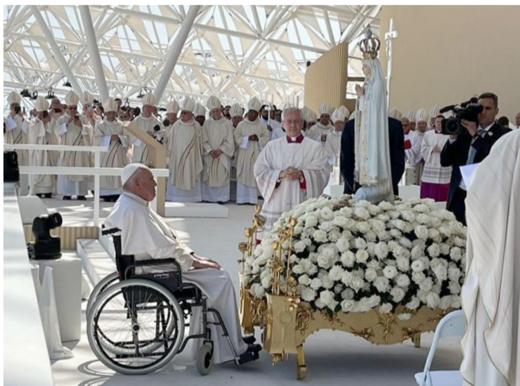
6 de agosto, Parque Tejo e no voo de regresso a Roma

Durante os 5 dias que esteve em Portugal, com uma agenda de encontros carregada e sem evitar qualquer assunto, o Papa percorreu os três principais documentos do seu pontificado: as encíclicas Evangelii Gaudium (Alegria do Evangelho), Laudato Si (Louvado sejas meu Senhor) e Fratelli Tutti (Todos irmãos)- dirigindo aos jovens uma herança que exige compromisso da parte de todos os cristãos.