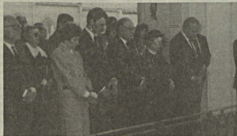
aeroporto da Portela, o Presidente da República proferiu o seguinte discurso de agradecimento ao Santo Padre:

A mensagem de amor, justiça e esperança que Vossa Santidade nos trouxe continuará a ecoar nos nossos corações e permanecerá como uma referência maior para todos os homens de boa vontade empenhados na construção de um mundo mais fraterno e humano.