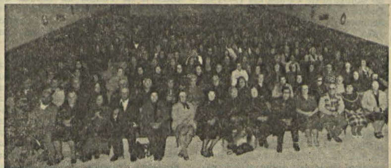
ASPECTO DO RETIRO DE DOENTES EM ANGRA DO HEROÍSMO