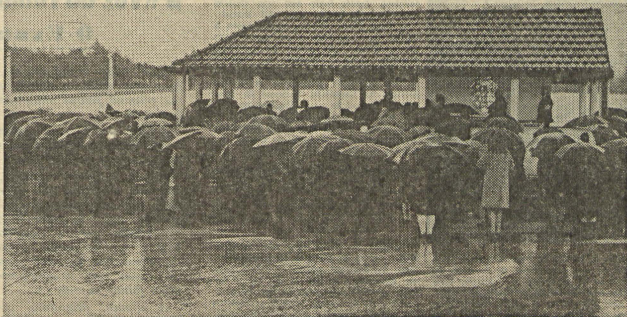
SANTUÁRIO DA FÁTIMA — Aspecto da capelinha das aparições nas peregrinações de inverno.

Desejamos a todos os nossos leitores feliz Páscoa, renovada no Amor de Cristo ressuscitado.