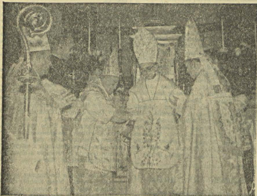
A Intronização, uma das cerimónias mais impressionantes da Sagr ação dum Bispo

O SAGRANTE toma a mão direita do Bispo sagrado, enquanto o primeiro Co-sagrante lhe toma a mão esquerda, e conduzem-no ao faldistório, colocado sobre o supedâneo, fazendo-o sentar; o SAGRANTE entrega-lhe o báculo, retirando-se em seguida para o lado do Evangelho, onde fica, descoberto, como que mostrando ao povo, em toda a sua glória pontifical, o novo Bispo.