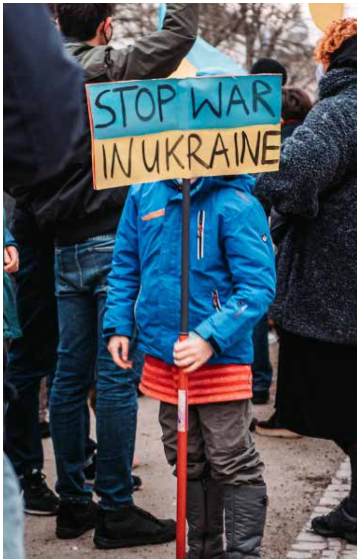
Jovem pede o fim da guerra na Ucrânia, numa manifestação em Berlim.

Na ocasião explicou, também, que tinha decidido publicar na Quinta-feira Santa a encíclica Pacem in Terris , para simbolicamente a relacionar com a mensagem de Jesus aos discípulos no Cenáculo – “Deixo-vos a paz, dou-vos a minha paz” –. A partir daí, como o próprio haveria de confessar, “a aspiração por uma paz justa, da qual somos hoje felizes testemunhas, penetrou na mente e no coração de todos, indistintamente, mas com uma ênfase mais marcada, ao que parece, dentro das classes trabalhadoras”.