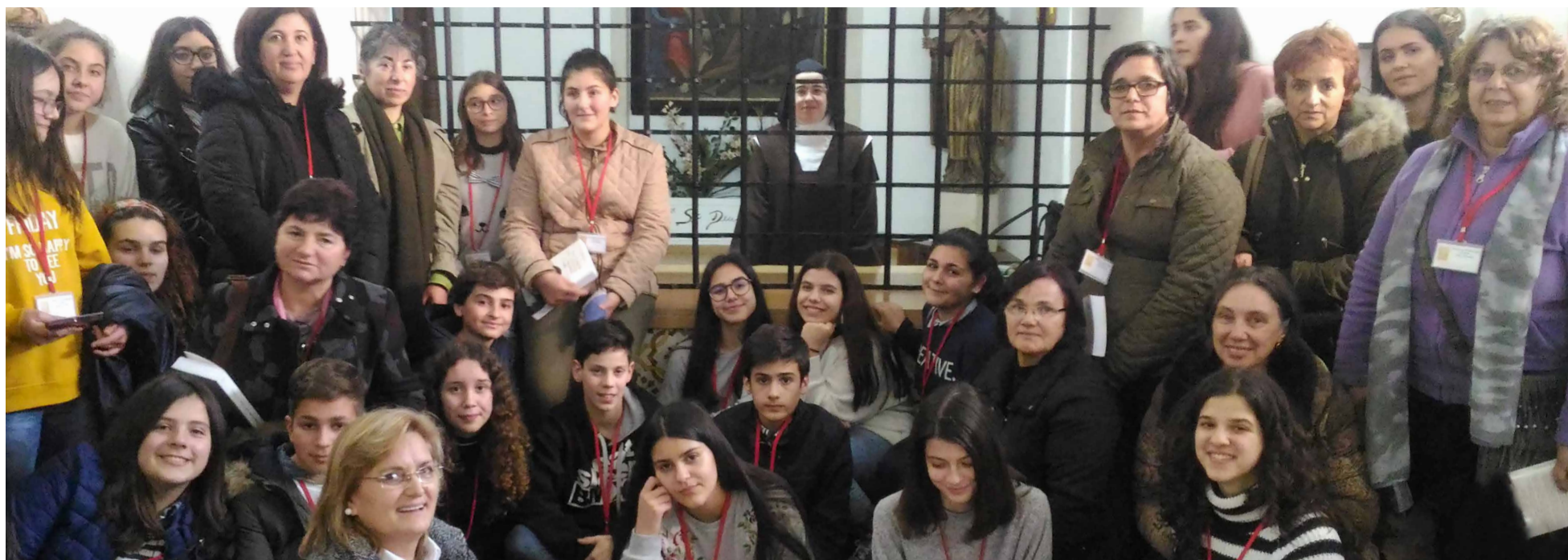
Jovens de Viana do Castelo visitam Carmelo de Santa Teresa, em Coimbra

Setor das Crianças e Adolescentes de Viana do Castelo