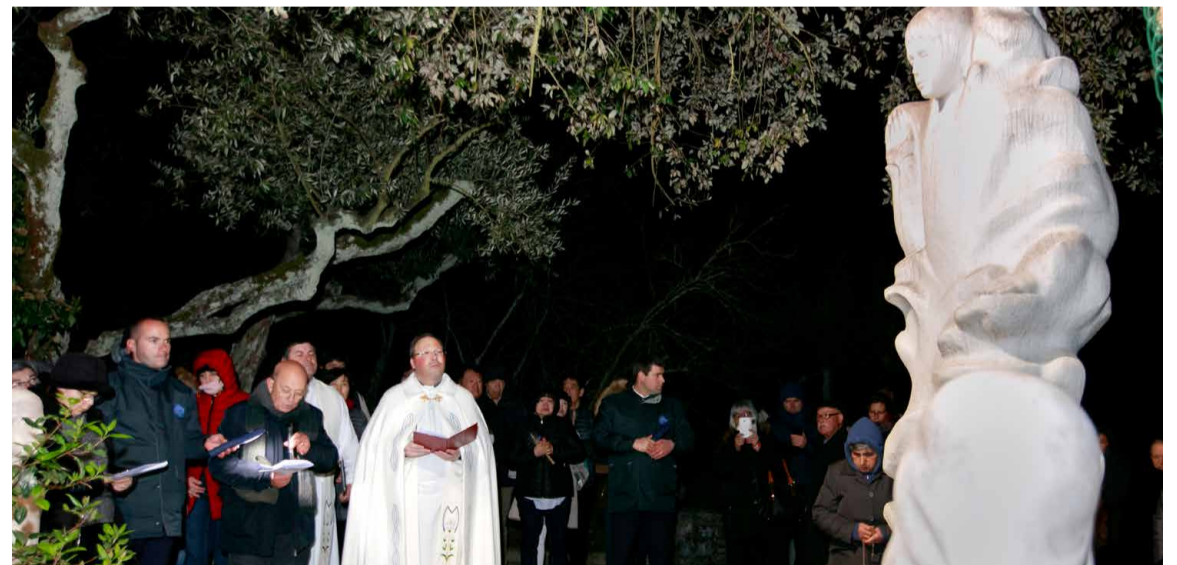
Evocação do Anjo da Paz volta a reunir centenas de peregrinos, especialmente estrangeiros