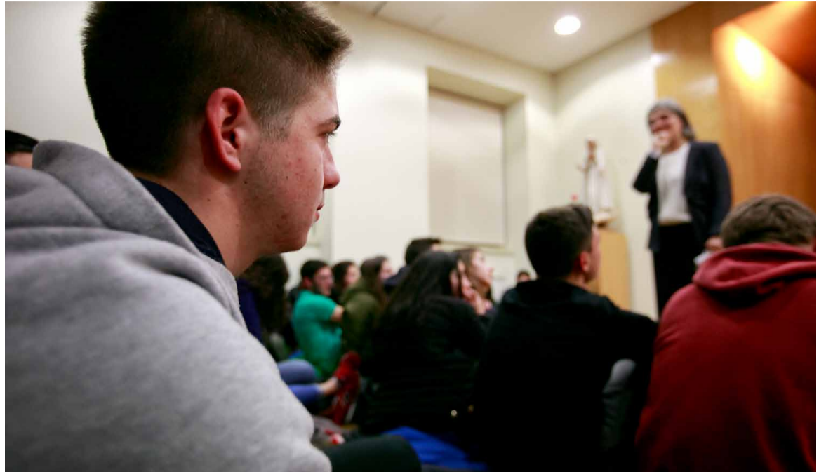
Jovens aderem cada vez mais às propostas do Santuário de Fátima

dos nós temos medo da solidão e, muitas vezes, enfrentamos esse medo de forma errada”, disse.