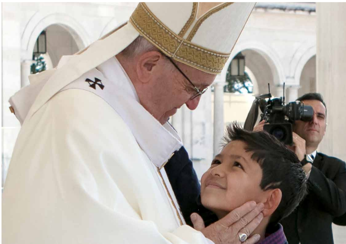
Encontro entre Francisco e Lucas, a criança miraculada, foi momento alto das celebrações do ano passado