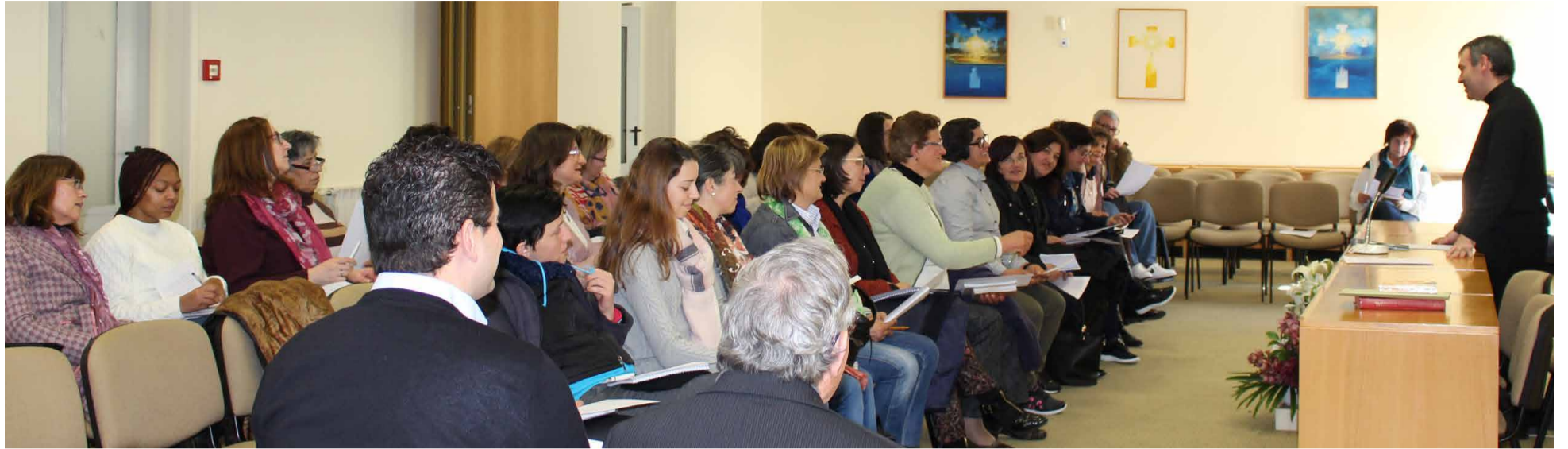
Catequistas dos jovens mensageiros do Movimento da Mensagem de Fátima participam em formação orientada por um capelão do Santuário. Na foto, momento da manhã formativa, a partir de um texto bíblico.

Nos dias 24 e 25 de fevereiro realizou-se na Casa de Retiros de Nossa Senhora das Dores o encontro de responsáveis diocesanos e paroquiais do setor das crianças, do Movimento da Mensagem de Fátima com a presença de 30 pessoas.