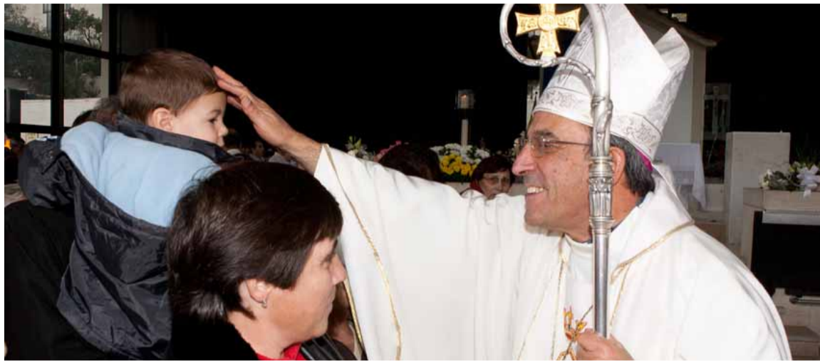
Felicitações a D. António Marto no 10º ano da sua ordenação episcopal!

Sob o título “No final do ano: sinais de vida e de esperança”, o Bispo de Leiria-Fátima recordou, na missa de 31 de Dezembro de 2010 no Santuário de Fátima, os quatro acontecimentos que em seu entender marcaram positivamente o ano de 2010.