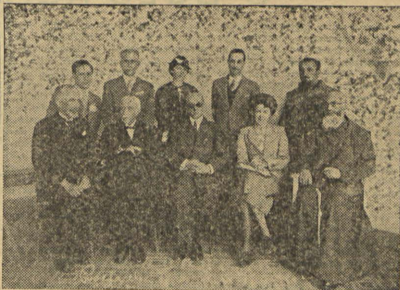
A ilustre Comissão que dirige os trabalhos do novo Santuário de Nossa Senhora da Fátima do Sumaré, sob a presidência do Sr. Côsul de Portugal que dá a direita ao Sr. Juiz da Confraria

Escrevem-nos de Kobe, no Japão, que todos os portugueses que habitam naquela cidade a principiaram pelo sr. Côsul, têm exposta em suas casas a imagem de Nossa Senhora da Fátima a qual prestam a maior veneração.