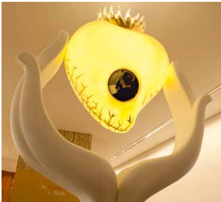
“Nel Cuore di Maria” è una delle tre opere create appositamente per questa esposizione ed è di Cristina Rocha Leiria

Nel 3° anno della celebrazione del Centenario delle Apparizioni di Fatima, il Santuario di Fatima inaugura una esposizione commemorativa dell'apparizione del giugno 1917, visibile al pubblico dal 24 novembre 2012 al 31 ottobre 2013.