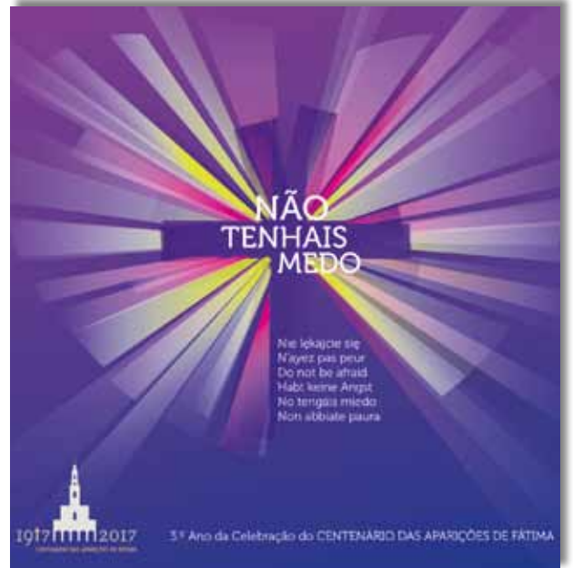
Questo è il cartellone che indica le iniziative dell’anno pastorale del 2012-2013: “Non abbiate paura”