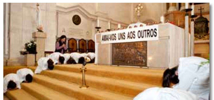
24 novembre 2012, Basilica della Madonna del Rosario: “Amatevi gli uni gli altri”

della Madonna di Fatima discendano su questi bambini, sui loro familiari, catechisti e professori.