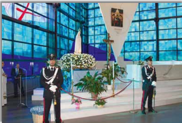
13 de maio de 2011, no Santuário de Nossa Senhora do Divino Amor, em Roma.