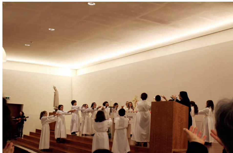
Crianças em adoração diante de Jesus Eucarístico na Capela da Morte de Jesus