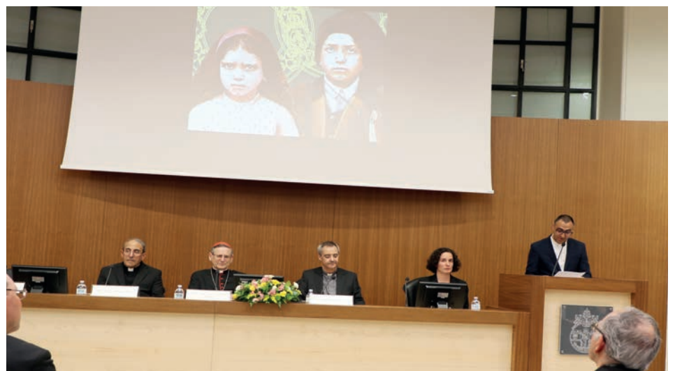
A Aula Magna da universidade Gregoriana foi palco para a reflexão sobre a espiritualidade dos videntes