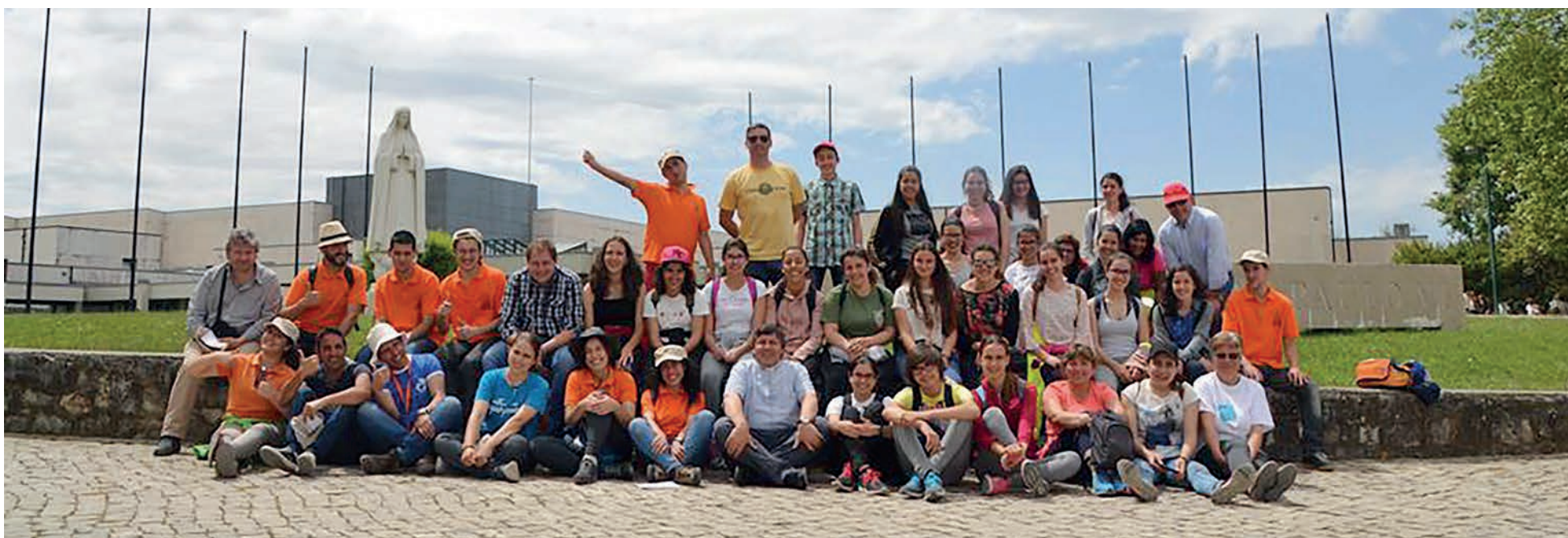
Jovens do Movimento da Mensagem de Fátima em frente ao Centro Pastoral de Paulo VI antes de iniciarem peregrinação