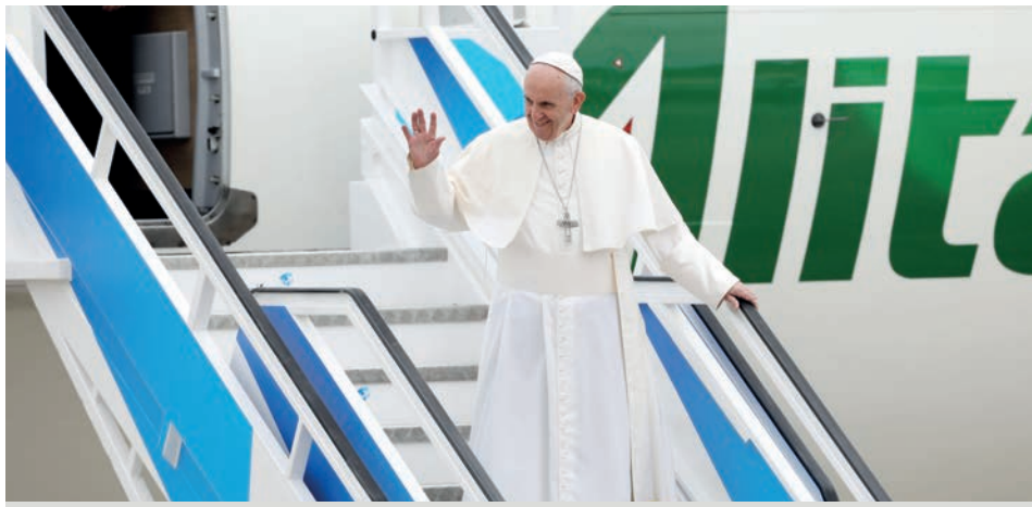
Santuário explodiu de alegria com chegada do Papa a Portugal