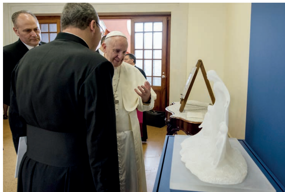
Escultura cativou o Papa Francisco