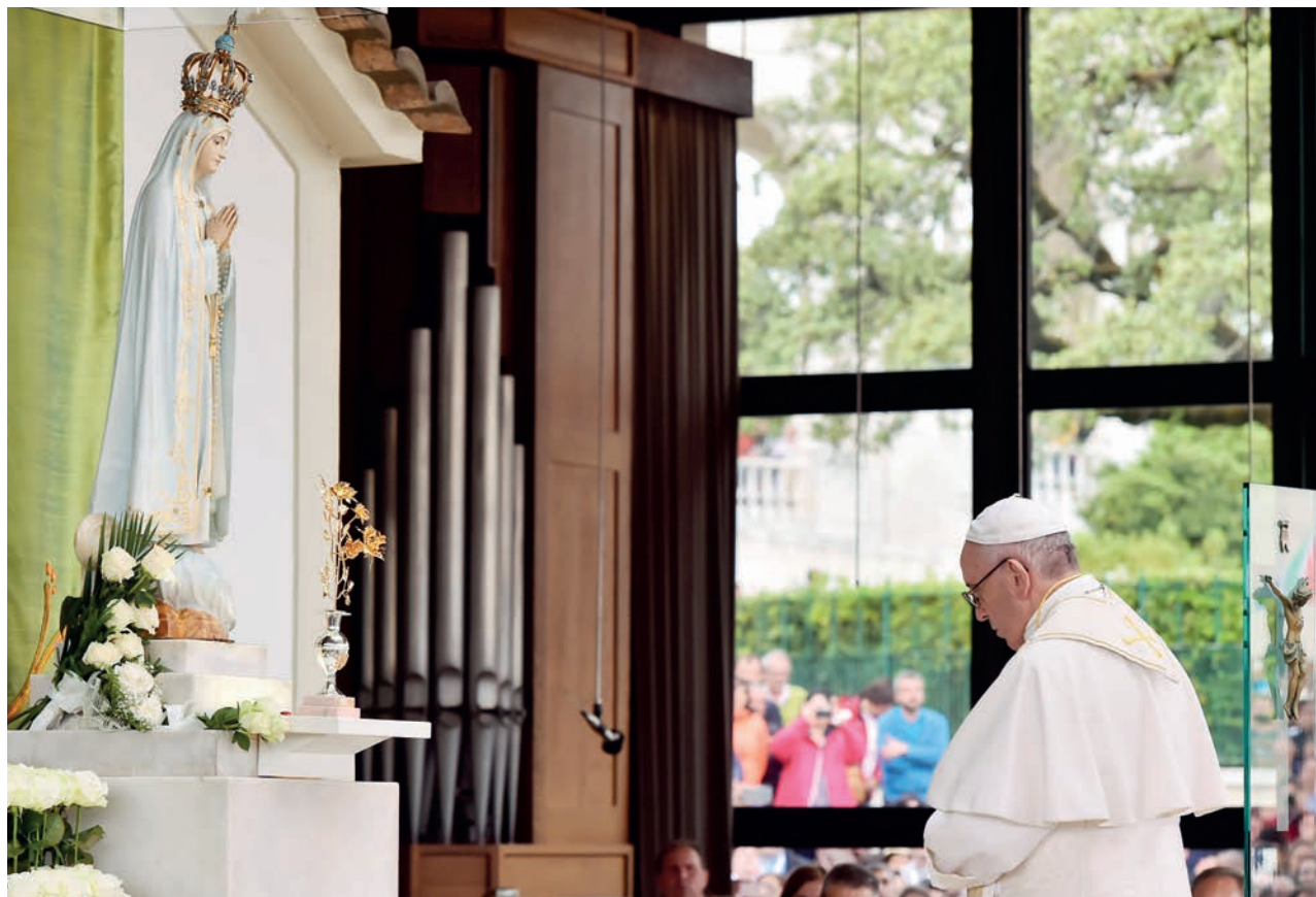
Momento de oração colocou Santuário em silêncio profundo durante 8 minutos