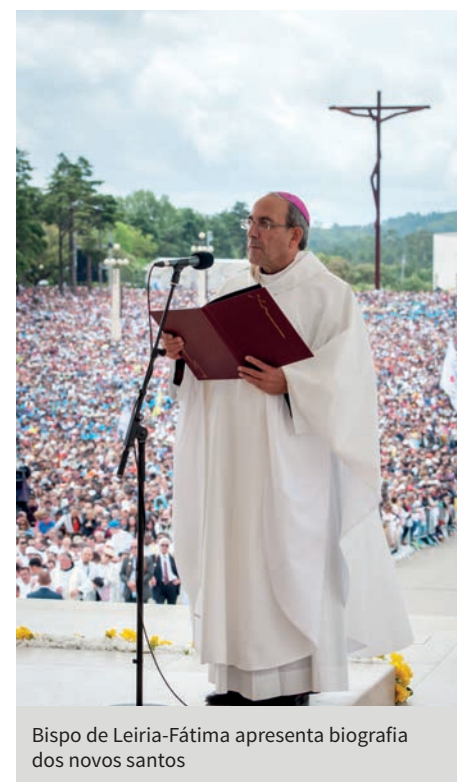
Bispo de Leiria-Fátima apresenta biografia dos novos santos

João Paulo II beatificou-os, também em Fátima, a 13 de maio do ano 2000. Neste ano de 2017, no Centenário das Aparições, foram canonizados pelo Papa Francisco. São desde então os mais jovens santos não mártires da história da Igreja.