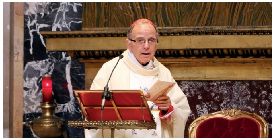
D. Manuel Clemente incentivou peregrinos a rezar a oração jubilar

O Cardeal Ângelo Amato falou acerca da santidade de Francisco e Jacinta, e em jeito de conclusão o bispo de Leiria-Fátima disse que “Francisco e Jacinta Marto são os primeiros destinatários da mensagem de Fátima e assim colaboradores de Deus na sua mensagem de misericórdia”.