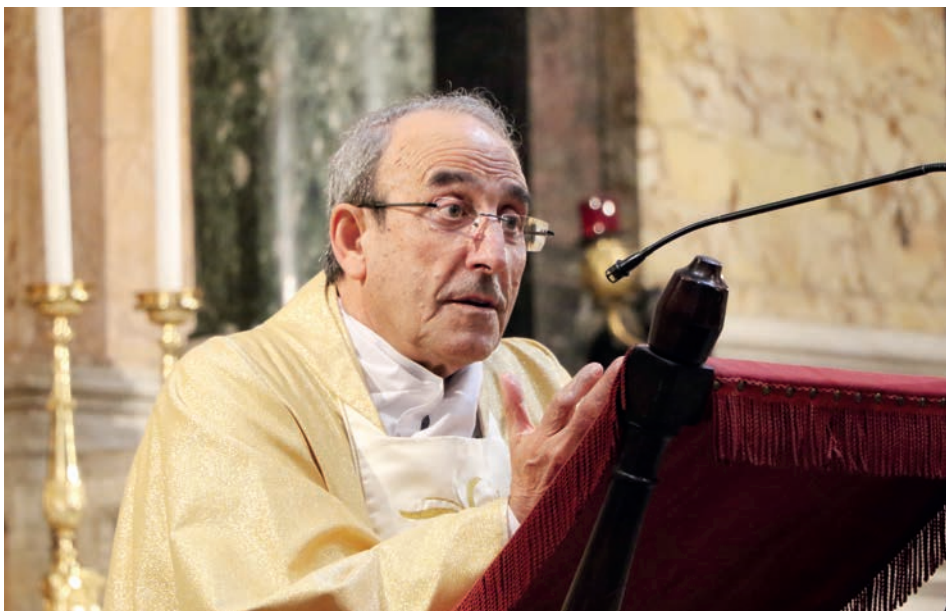
O bispo de Leiria-Fátima lembrou o “amor” dos pequenos Pastores a Deus