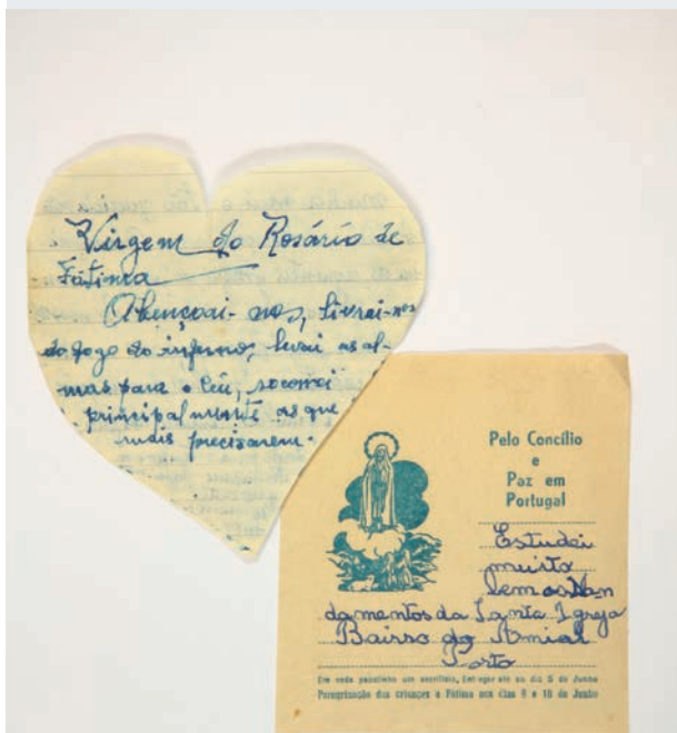
SANTUÁRIO DE NOSSA SENHORA DO ROSÁRIO DE FÁTIMA – [Correio de Nossa Senhora]. Circa 1922(?)–2016. Arquivo do Santuário de Fátima. Série Correio de Nossa Senhora.