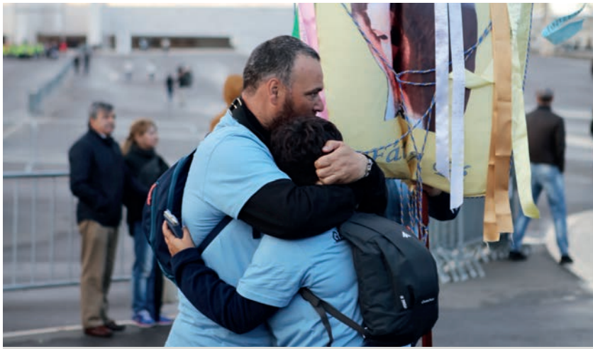
O abraço dos peregrinos ao chegarem ao Santuário