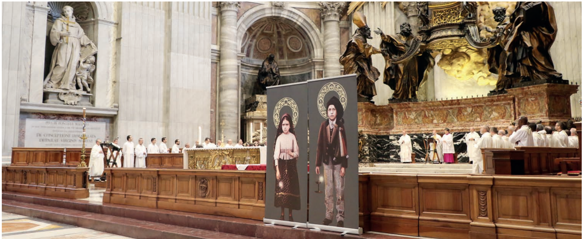
A Basílica de S. Pedro, em Roma, acolheu as relíquias de São Francisco e Santa Jacinta