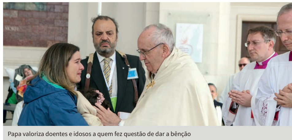
Papa valoriza doentes e idosos a quem fez questão de dar a bênção

Terminou esta mensagem assegurando-lhes a oração da Igreja e a certeza de