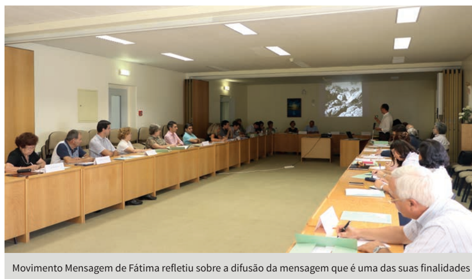
Movimento Mensagem de Fátima refletiu sobre a difusão da mensagem que é uma das suas finalidades