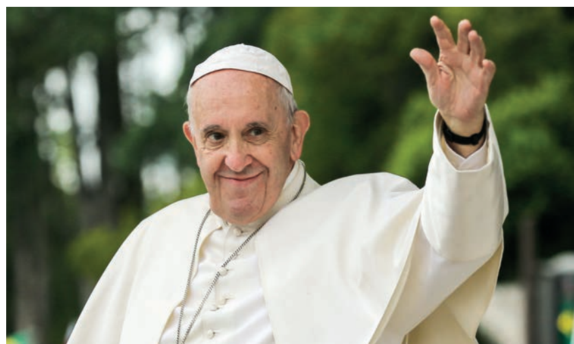
Francisco fez-se peregrino no meio dos peregrinos e celebrou o Centenário das Aparições

“Não queiramos ser uma esperança abortada”, prosseguiu.