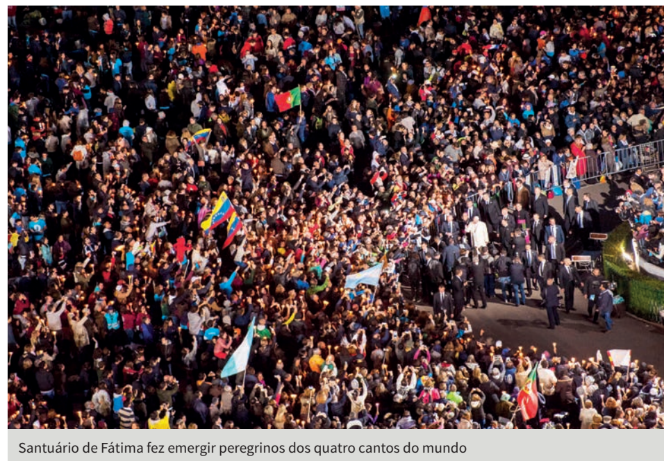
Santuário de Fátima fez emergir peregrinos dos quatro cantos do mundo

“Peço a todos para unirem-se a mim como peregrino da esperança e da paz: que as vossas mãos em oração continuem a apoiar as minhas” – mensagem enviada