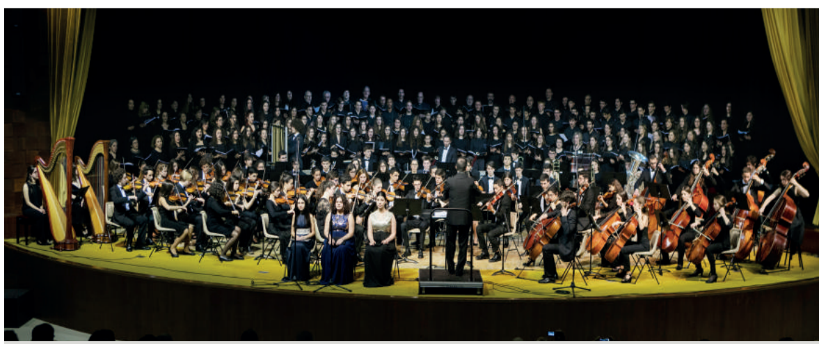
Conservatório do Porto encheu a alma à assembleia do Centro Pastoral de Paulo VI