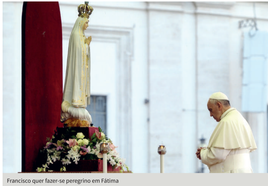
Francisco quer fazer-se peregrino em Fátima

O Papa argentino promoveu um Sínodo sobre a Família, em duas sessões, com