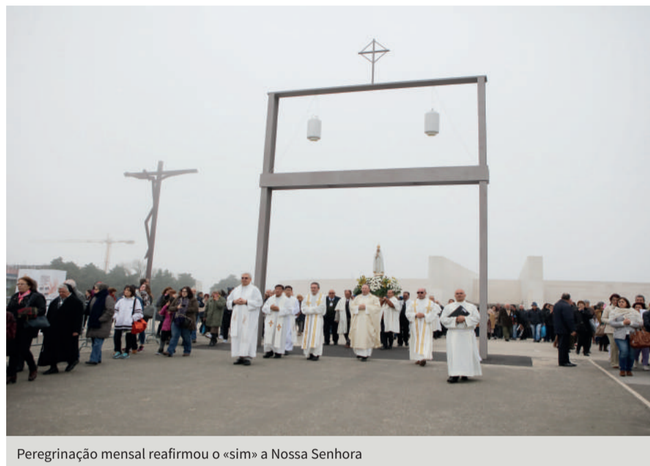
Peregrinação mensal reafirmou o «sim» a Nossa Senhora

A peregrinação mensal de 13 de dezembro foi a última deste ano de 2016. Começou com a meditação do Rosário na Capelinha, às 10h, seguida da procissão até à Basílica da Santíssima Trindade.