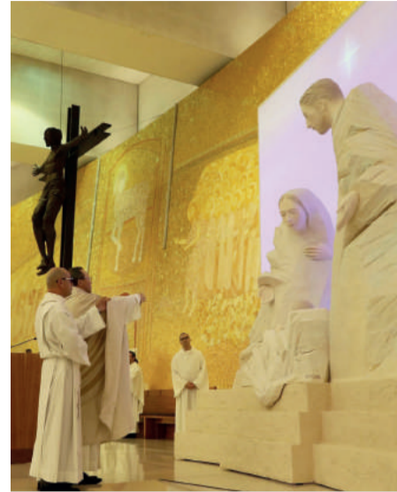
Reitor do Santuário convidou peregrinos a não «perder o essencial»