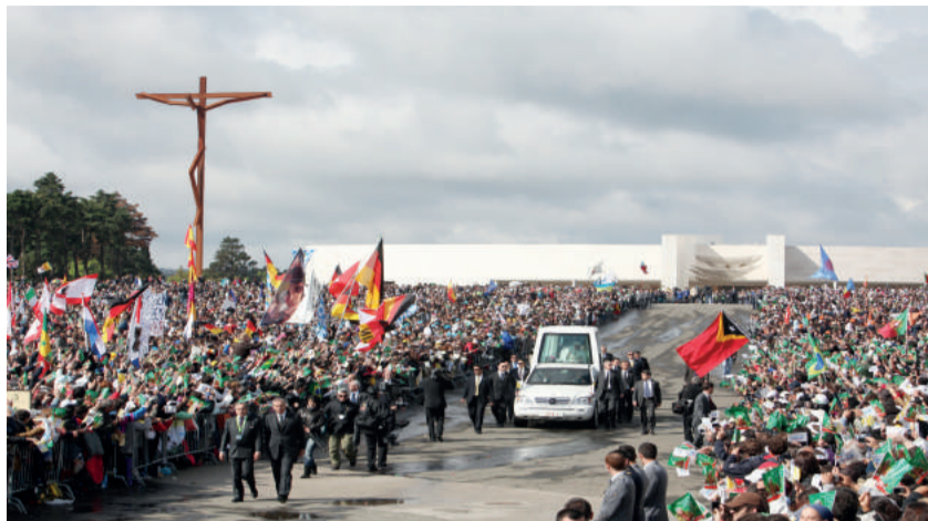
Os Papas e a Cova da Iria estão ligados na própria mensagem de Fátima