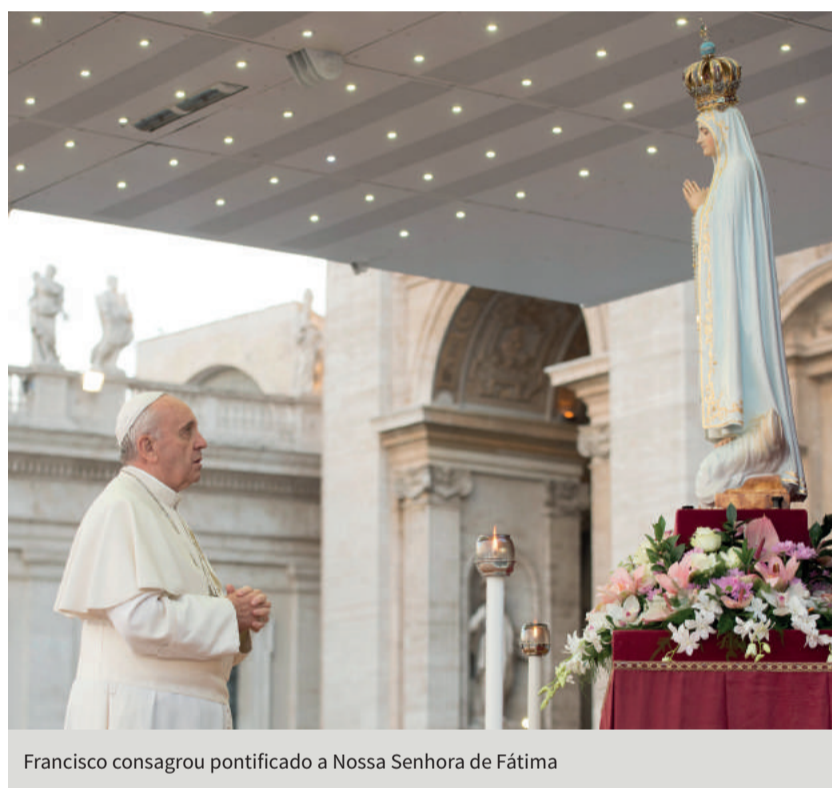
Francisco consagrou pontificado a Nossa Senhora de Fátima

Recorde-se que, a 7 de setembro do ano passado, no encontro dos bispos de Portugal com o Papa durante a visita ad limina , Francisco demonstrou o «desejo profundo» de visitar Fátima, ao afirmar: «tengo ganas de ir a Fátima (quero ir a Fátima)». E já tinha dito também, em privado, ao bispo da diocese de Leiria-Fátima, em abril de 2015, que, se Deus lhe desse vida e saúde, estaria na Cova da Iria para celebrar o Centenário das Aparições de Fátima.