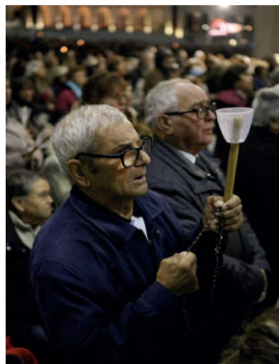
Peregrinos rezam o terço na Capelinha das Aparições

Cada vez que se reza uma Ave-Maria, entregue-se uma rosa a Nossa Senhora e por cada rosário completo que lhe rezamos, entregamos-lhe uma coroa de rosas