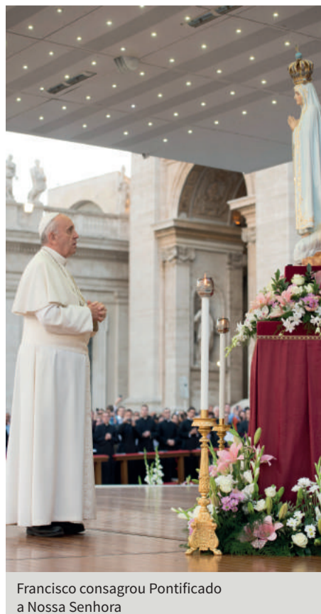
Francisco consagrou Pontificado a Nossa Senhora