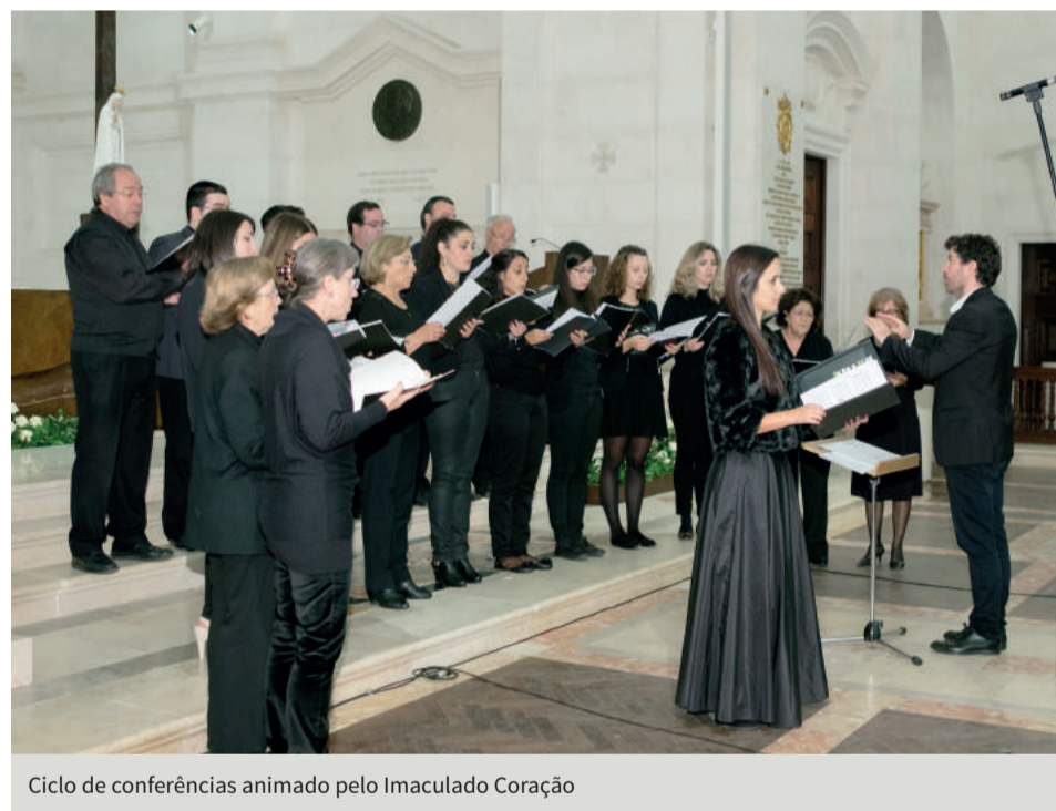
Ciclo de conferências animado pelo Imaculado Coração