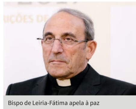
Bispo de Leiria-Fátima apela à paz

O bispo de Leiria-Fátima afirma, na sua mensagem de Natal para 2016, que celebrar