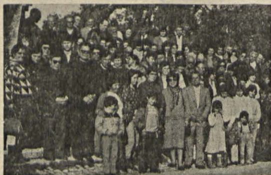
Encontro de animadores de grupo da Zona Sul de pastoral da diocese de Coimbra

E digo mais: faz pena que a Mensagem de Fátima seja tão desconhecida e mal entendida e apreciada. Descobri que se trata dum Mensagem actual, identificada com o Evangelho e de acordo com o Magistério da Igreja.