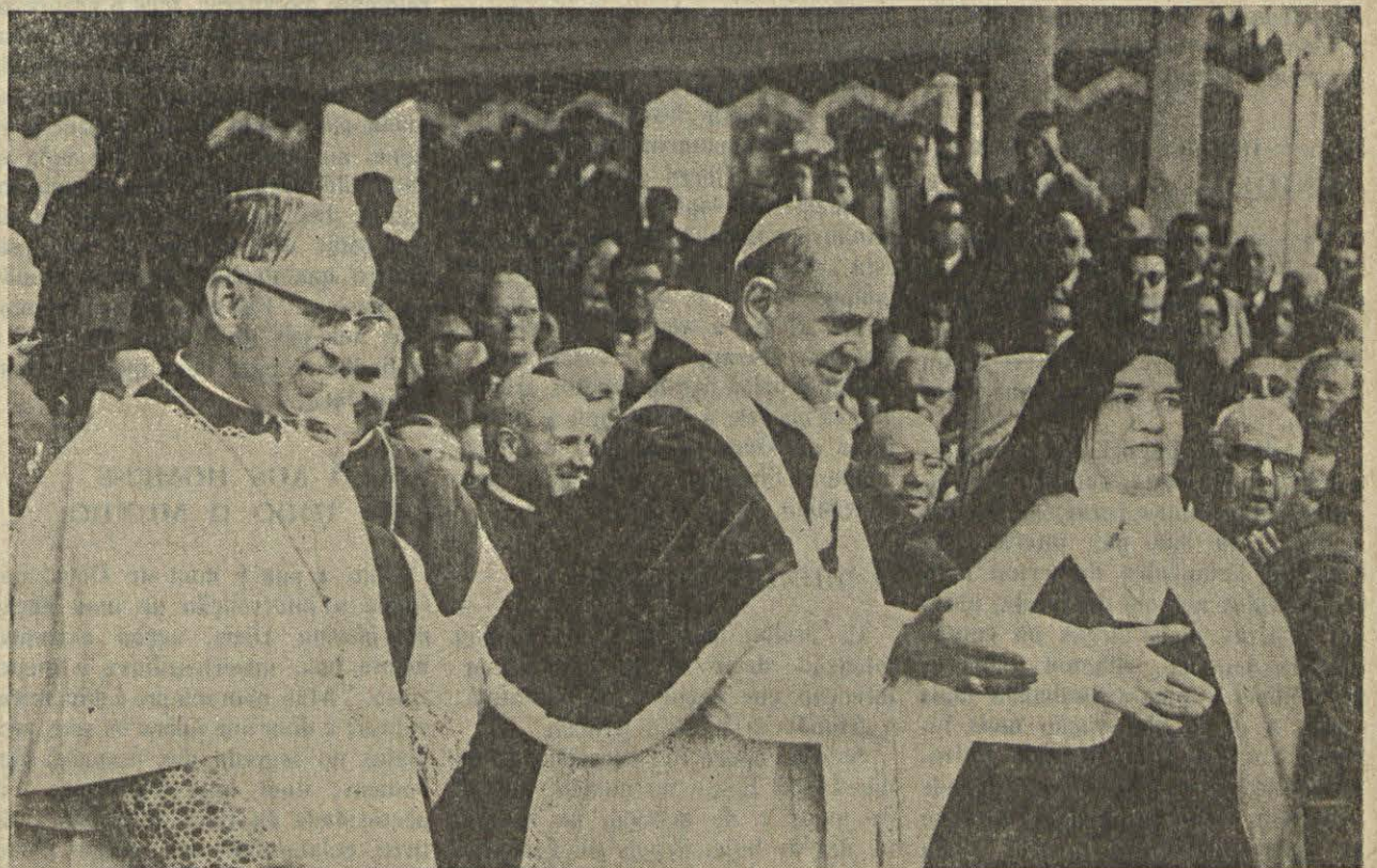
O PAPA SORRI CARINHOSAMENTE PARA A MULTIDÃO, AO LADO DA IRMÃ LÚCIA, A ÚNICA SOBREVIVENTE DOS PASTORINHOS DE HÁ 50 ANOS. OS PEREGRINOS APLAUDIRAM COM EMOÇÃO O VIGÁRIO DE CRISTO.

É com alegria que Nos encontramos convosco, Irmãos e Filhos caríssimos, e que vos associamos à profissão da Nossa devoção a Maria Santíssima e à Nossa oração, a fim de que seja mais manifesta e mais filial a comum veneração e mais aceite a Nossa invocação.