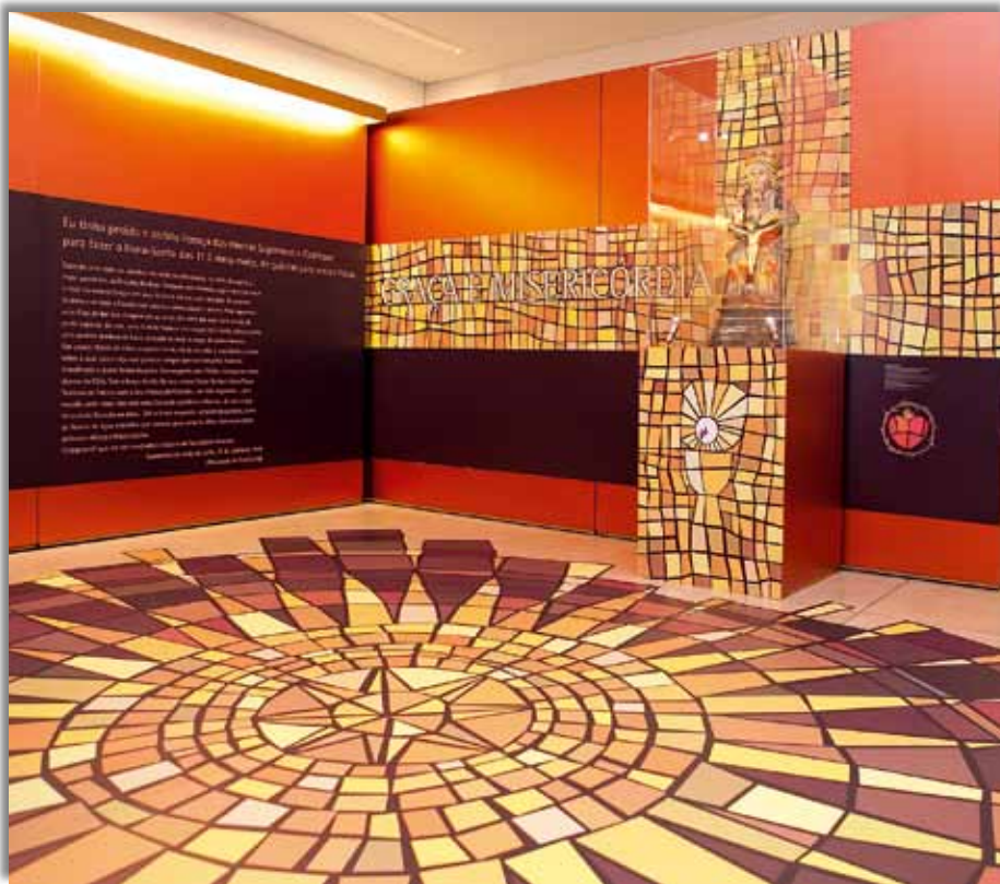
Pormenor de la exposición “En el camino de la luz – Las apariciones de Fátima”.

La fidelidad al mensaje de Fátima será, por eso, la mejor contribución del Santuario a la Iglesia portuguesa. Pero sentimos igualmente la responsabilidad de desenvolver este proyecto pastoral del Santuario en comunión con el plano pastoral de la Diócesis de Leiria-Fátima y con el proyecto pastoral de la Conferencia Episcopal Portuguesa”, afirmó el P. Cabecinhas.