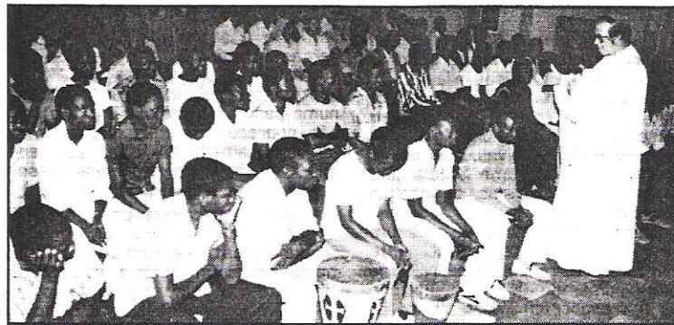
D. Manuel Vieira Pinto, Arcebispo de Nampula, falando no dia da inauguração do Seminário.

A vida do seminário tem sido possível graças às ajudas vindas de Roma e da Alemanha, com expressa referência à "Obra de S. Pedro Apóstolo".