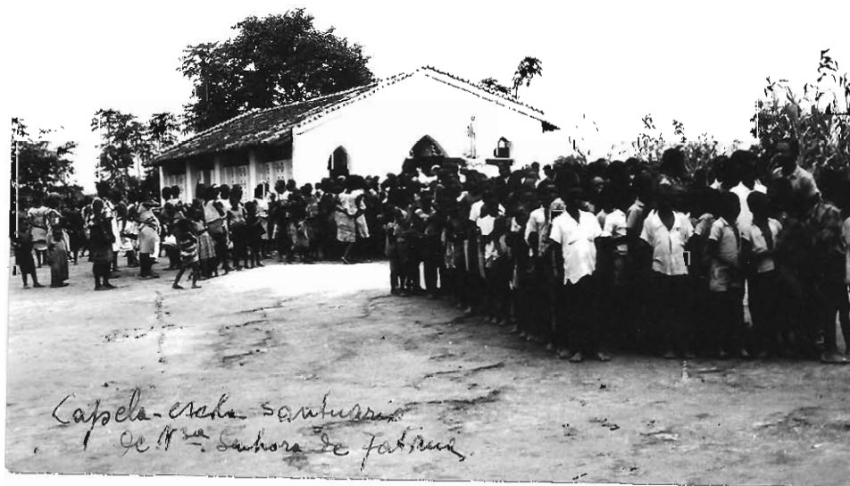
Capela-escola santuário de N ra Senhora de Fátima.

fotos enviadas pelo P. Emilio Bertuletti, superior da Missão de S. Tiago de Mamarroi- Quilimane, com 70.000 habitantes. em 25.7.1968