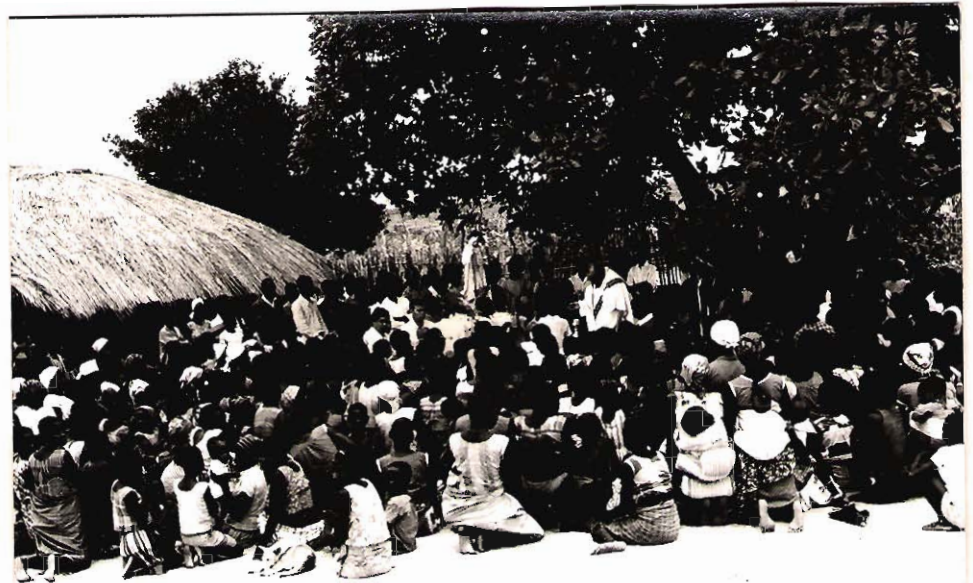
A capela era pequena... por tanta gente!

fotos enviadas pelo P. Emilio Bertuletti, superior da Missão de S. Tiago de Namarroi - Quelimane, com 70.000 habitantes- Enviadas em 25.7.1968