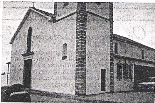
Vista parcial da Igreja renascida das cinzas e agora inaugurada

Após árduo trabalho levado a efeito pela Associação de Melhoramentos da freguesia, teve finalmente a sua inauguração, no passado dia 26 de Junho, a Igreja Matriz de Casais.