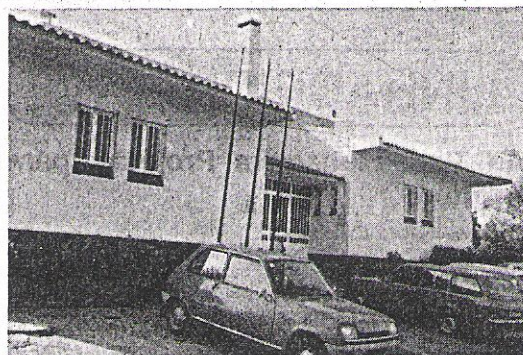
Associação Cultural e Recreativa do Centro da Freguesia de Casais

— Casais recebeu o Presidente da Câmara e sua Comitiva no dia 23-6-93