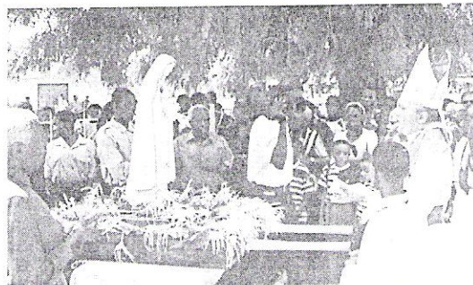
O Sr. Bispo de S. Tomé e Príncipe coroando a imagem do Imaculado Coração de Maria.

Desde os primeiros contactos feitos nesse país, em 1990, o Grupo da Imaculada já ali se deslocou várias vezes: uma vez em peregrinação de camioneta e outras em visitas de dois ou mais elementos do Grupo, para estar presentes na