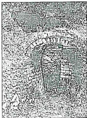
O forno do Pisão.