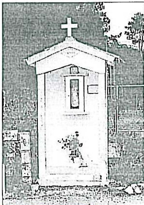
Deus presente em cada curva.

A parte a olaria, os dois milhares de habitantes que compõem a freguesia ocupam-se com um sem número de actividades que vão desde a transformação de madeiras até à agricultura,