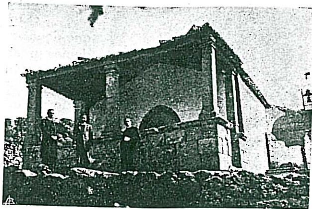
Vila do Touro — Capela de Nossa Senhora do Mercado

A devoção a Nossa Senhora do Mercado é tão grande que muitas pessoas vão rezar todos os dias à capela. As mulheres e raparigas têm como obrigação, durante a quaresma, ir rezar à noitinha o terço à capela, quotidianamente. Em todos os sábados da quaresma o pároco vai com o povo rezar o terço junto da capela. Os velhos da freguesia contam que se lembram de ouvir dizer a seus pais que vinham assistir à festa de Nossa Senhora do Mercado as au-