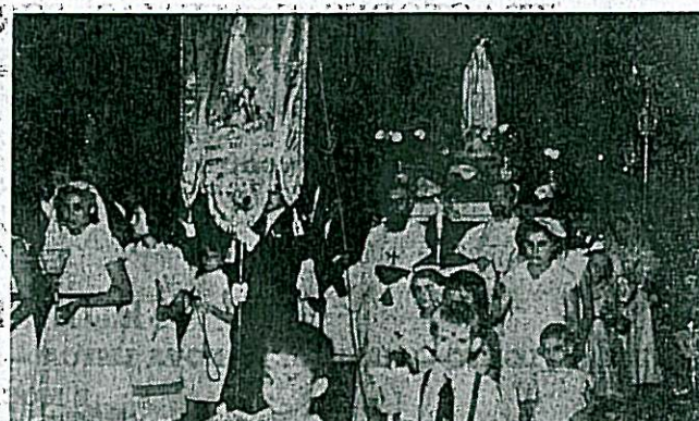
Um pormenor da procissão de velas em Léopoldville