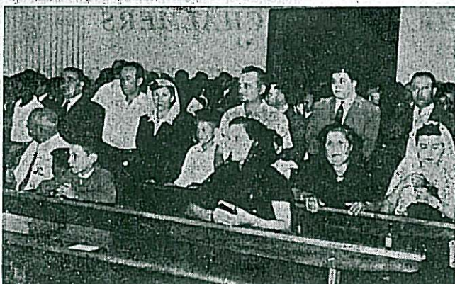
Um aspecto da assistência à Missa da inauguração da igreja