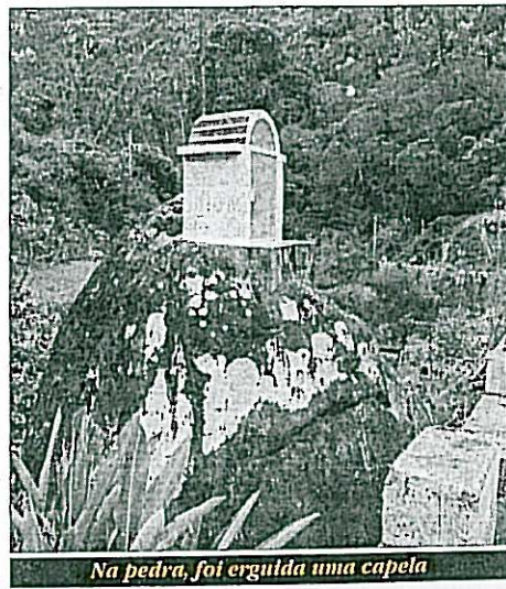
Na pedra, foi erguida uma capela