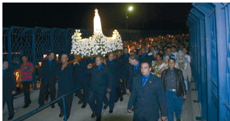
Procissão Luminosa através da "Passarela da Fé"