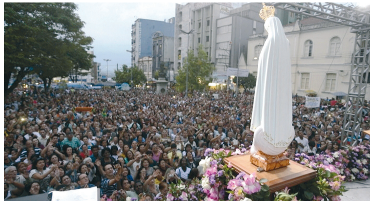
Acolhimento da Imagem na Igreja Matriz-Basilica de Aparecida