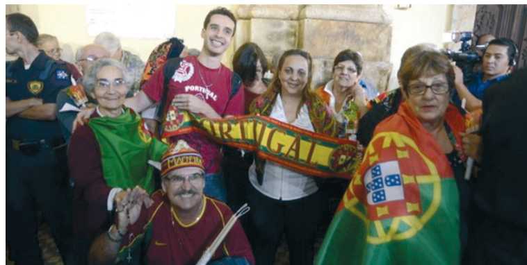
Comunidade portuguesa no Brasil entre os devotos