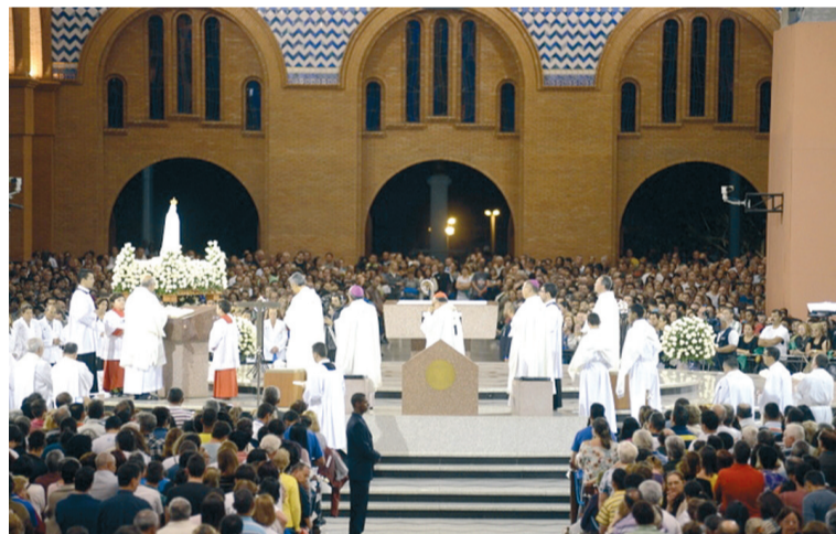
Acolhimento da Imagem na Basílica do Santuário de Aparecida