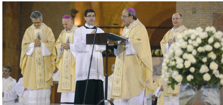
Missa da entronização da Imagem num monumento construído no exterior da Basílica