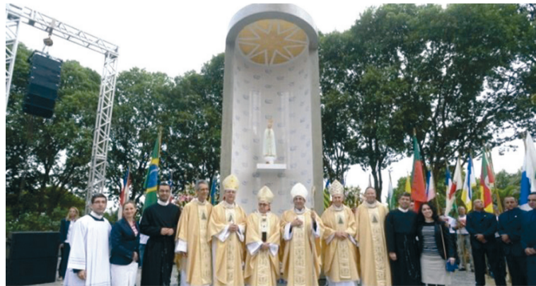
Junto do Monumento a Nossa Senhora de Fátima, a delegação vinda do Santuário de Fátima e os responsáveis pela arquidiocese e pelo Santuário de Aparecida

Santuário de Nossa Senhora da Conceição Aparecida