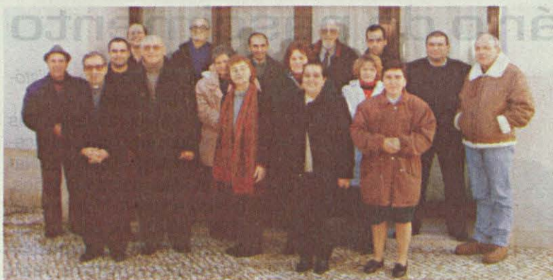
Um grupo de responsáveis que prestam assistência aos peregrinos a pé

No dia 4 de Janeiro reuniu mais uma vez a equipa coordenadora da assistência aos peregrinos a pé e no dia 11 do mesmo mês, os responsáveis dos postos de assistência. Desde há anos a esta parte que o Movimento da Mensagem de Fátima tem dado a este sector uma particular atenção. Algo tem melhorado. É consolador verificarmos o espírito de generosidade e colaboração que existe entre todos os responsáveis que têm estado ligados connosco no serviço médico-sanitário e pastoral. Nota-se um certo bem estar e segurança nos peregrinos, pois eles próprios testemunham a nossa unidade e colaboração. Salientamos a ajuda d'alguns populares que colaboram com o Movimento da Mensagem de Fátima, estão identificadas com uma bandeira hasteada junto dos respectivos postos, com o desenho da Basílica do Santuário de Fátima.