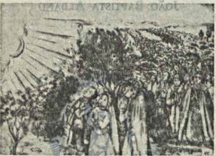
13 de Setembro. Uma enorme multidão rezava o terço enquanto esperava...