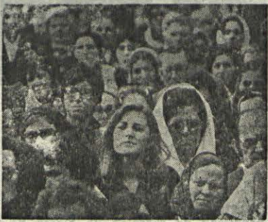
enquadrado houiver portugueses cu seus osu anhor