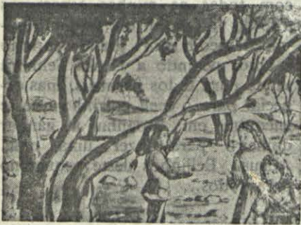
Às vezes davam as merendas a outros meninos e eles comiam bolotas amargas.