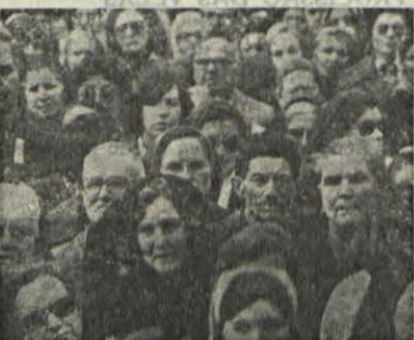
fico êxito, e deu, no fim, a Bênção Papal.