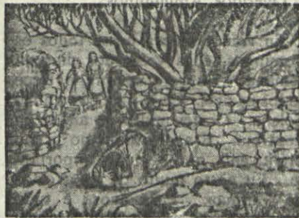
O Francisco afastava-se para rezar, como o Anjo lhes tinha ensinado.