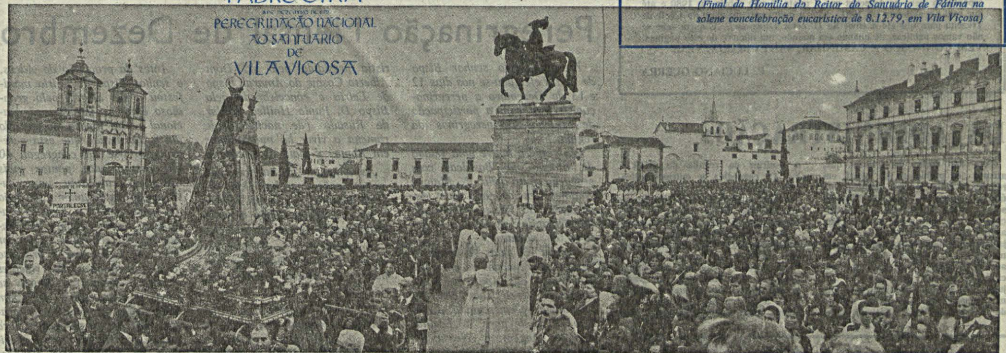
PEREGRINAÇÃO NACIONAL AO SANTUÁRIO DE VILA VIÇOSA