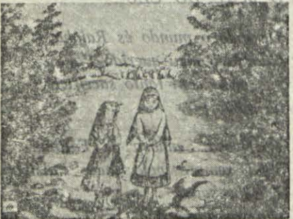
Olha! A corda faz doer; podíamos oferecer a Deus este sacrifício.