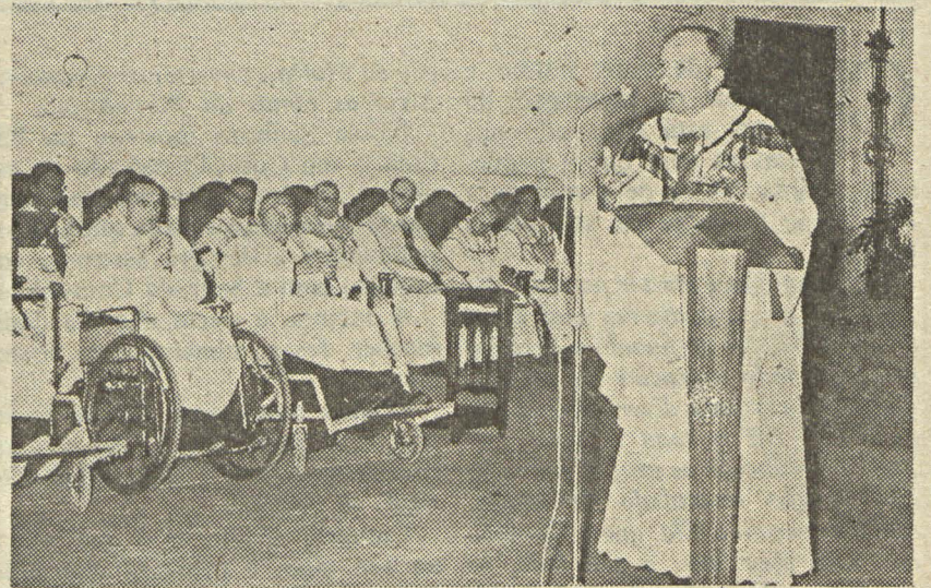
O SR. BISPO DE ZACAPA À HOMILIA NUMA DAS CONCELEBRAÇÕES