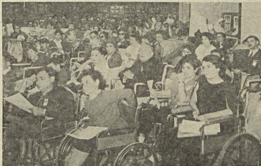
ASPECTO DUMA DAS SESSÕES DO I CONGRESSO CATÓLICO INTERNACIONAL DO DOENTE

Que os estimule também o seu exemplo materno, e o seu valimento lhes proporcione conforto, alívio e resignação e que, sentindo-se também