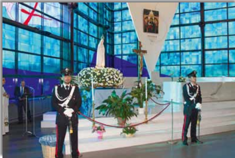
13 de mayo de 2011, Santuario de Nuestra Señora del Divino Amor, Roma