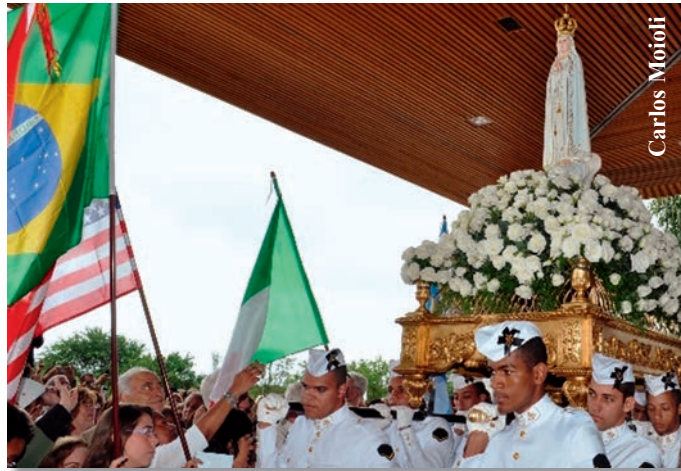
La Imagen de Nuestra Señora allí venerada fue bendecida en el Santuario de Fátima en Portugal, el 13 de mayo de 2011.