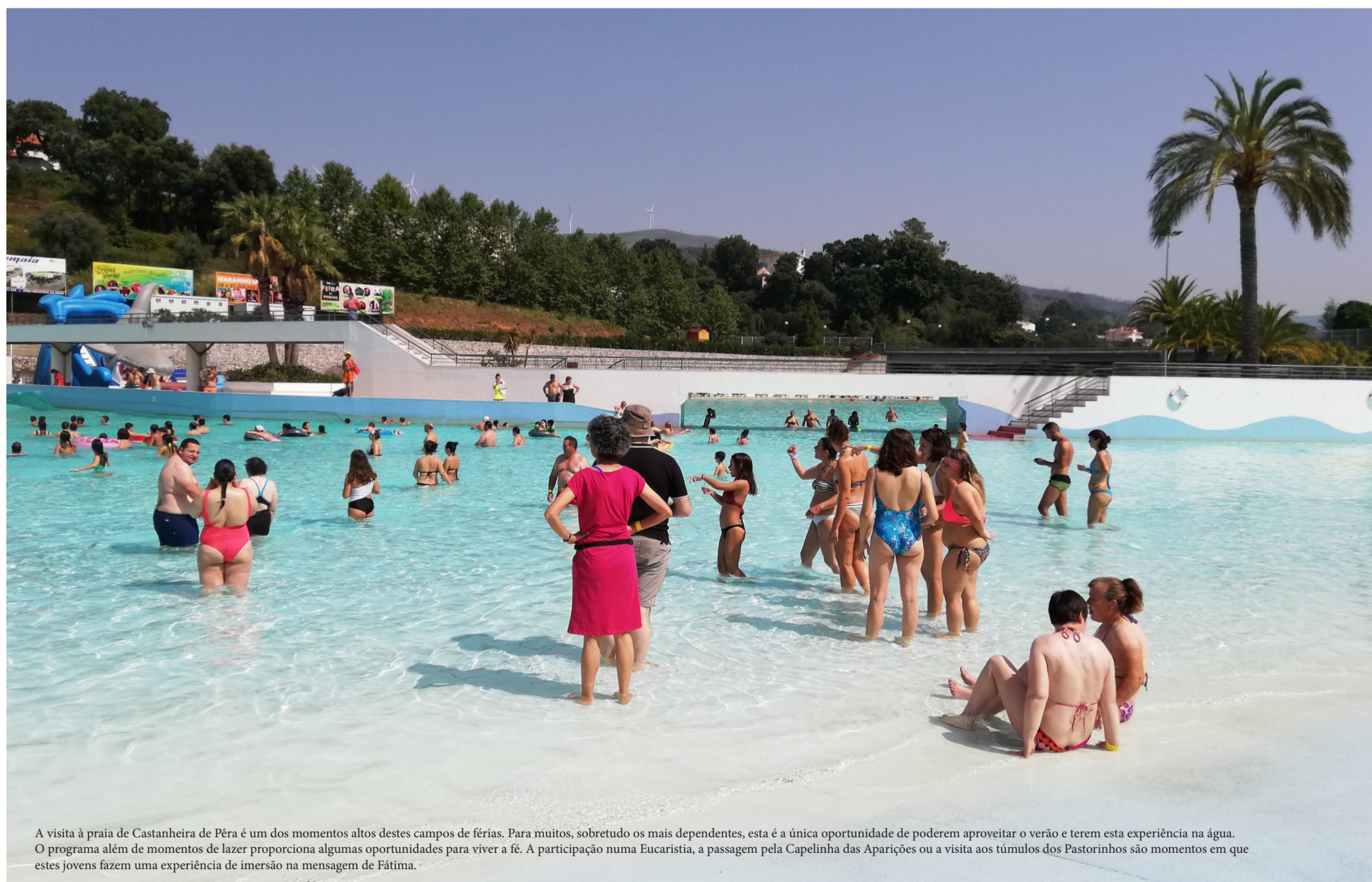
A visita à praia de Castanheira de Pêra é um dos momentos altos destes campos de férias. Para muitos, sobretudo os mais dependentes, esta é a única oportunidade de poderem aproveitar o verão e terem esta experiência na água. O programa além de momentos de lazer proporciona algumas oportunidades para viver a fé. A participação numa Eucaristia, a passagem pela Capelinha das Aparições ou a visita aos túmulos dos Pastorinhos são momentos em que estes jovens fazem uma experiência de imersão na mensagem de Fátima.

Ao todo, desde o início deste programa, o Santuário já proporcionou férias a mais de 1 300 pessoas com deficiência e a mais de 800 pais/cuidadores. Há voluntários que anualmente reservam férias para esta altura só para poderem participar nesta iniciativa de acolhimento e acompanhamento de pessoas com deficiência.