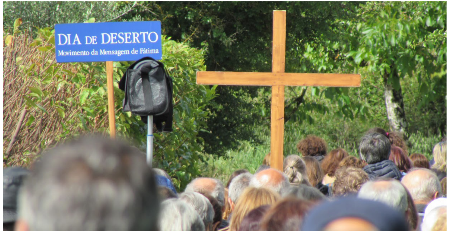
Peregrinos nos Valinhos a caminho do Calvário Húngaro