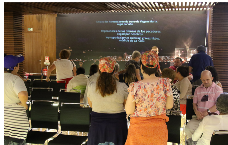
Na Casa das Candeias, os participantes são acolhidos pelas Irmãs da Aliança de Santa Maria, que lhes dão a conhecer a relação entre Nossa Senhora e os Pastorinhos, lembrando-lhes a importância da oração do terço e da forma como os pastorinhos abrem o coração a Deus.

A Voz da Fátima agradece os donativos enviados para apoio da sua publicação.