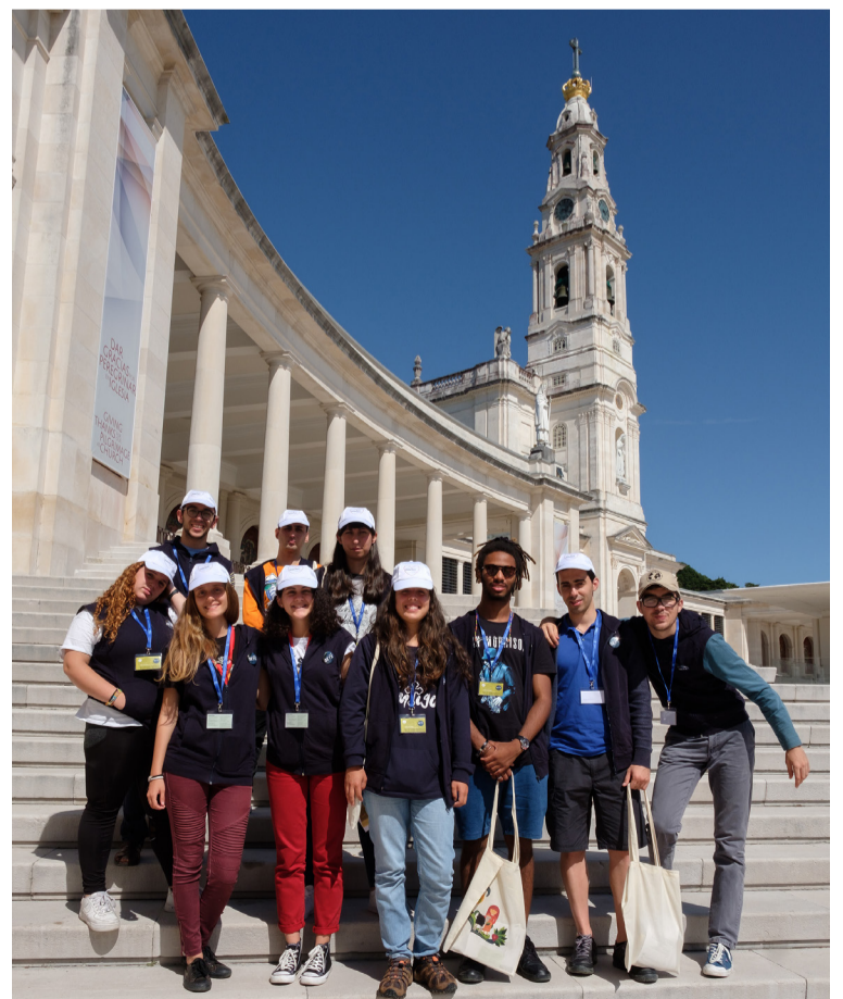
Este ano, o Projeto SETE envolverá mais de 60 participantes de Portugal e estende-se, pela primeira vez, à participação de jovens espanhóis