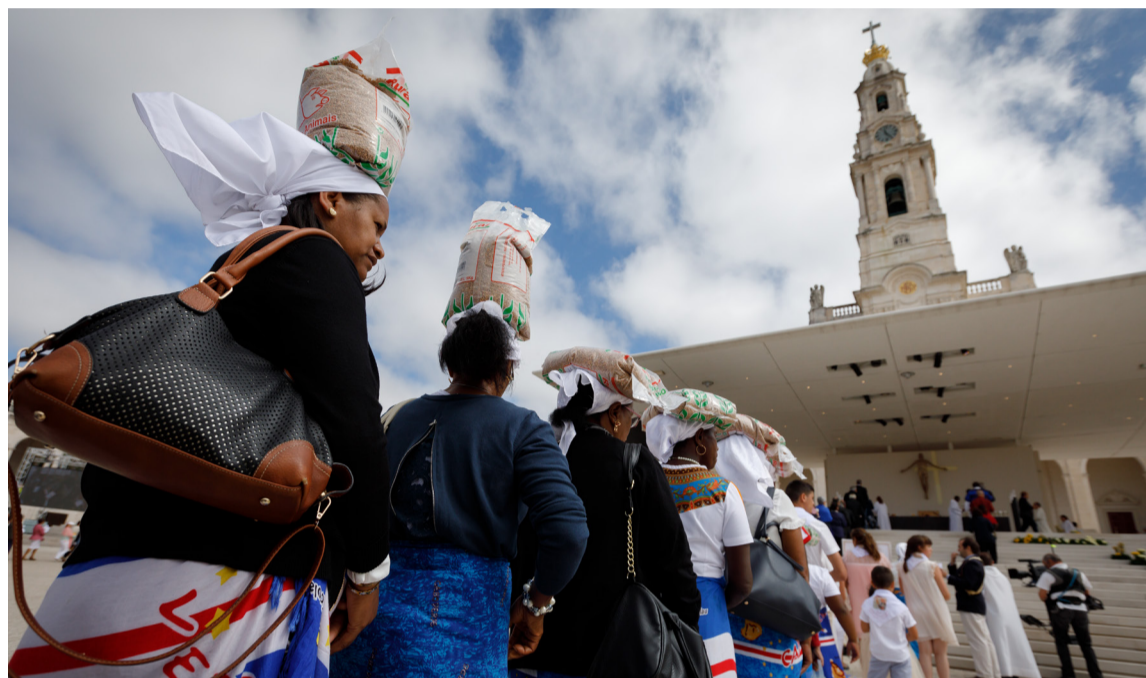
A oferta do trigo, pelos peregrinos, no momento da apresentação dos dons da Missa Aniversária do dia 13 é uma das tradições cumpridas nesta Peregrinação.

Que a peregrinação de 12 e 13 de agosto a Fátima nos ajude a tomarmos consciência do muito que podemos fazer para “acolher, proteger, promover e integrar” os migrantes e refugiados.