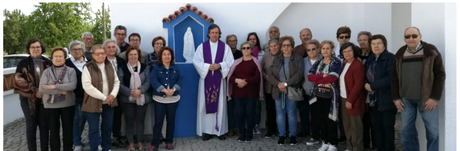
Peregrinos em Campo Maior com o seu assistente

Oração, penitência, reconciliação, adoração, Eucaristia, todos viveram a Mensagem de Fátima e ficaram renovados para a testemunharem.