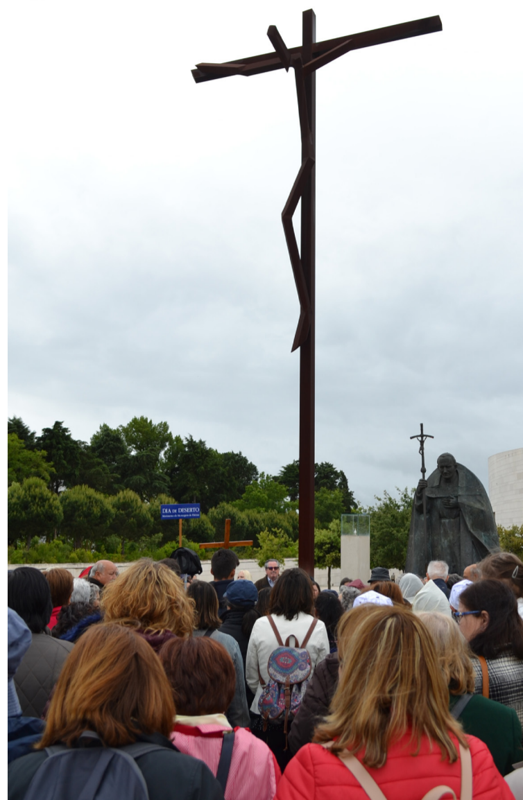
Peregrinos junto da Cruz Alta para começar a oração do terço