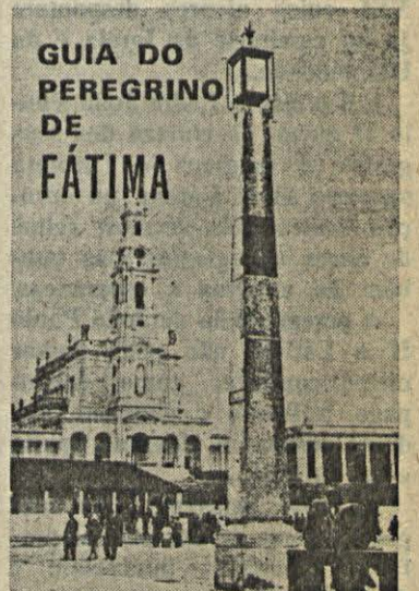
GUIA DO PEREGRINO DE FÁTIMA

As 16 horas houve um plenário diocesano na escadaria da Basílica. Finalmente, rezou-se o terço junto da Capelinha das Aparições.