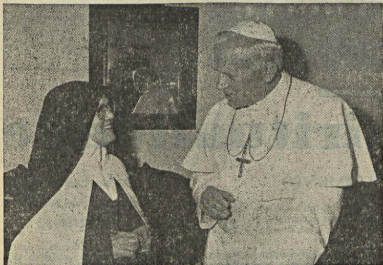
JOÃO PAULO II COM A IRMÃ LÚCIA NA FÁTIMA