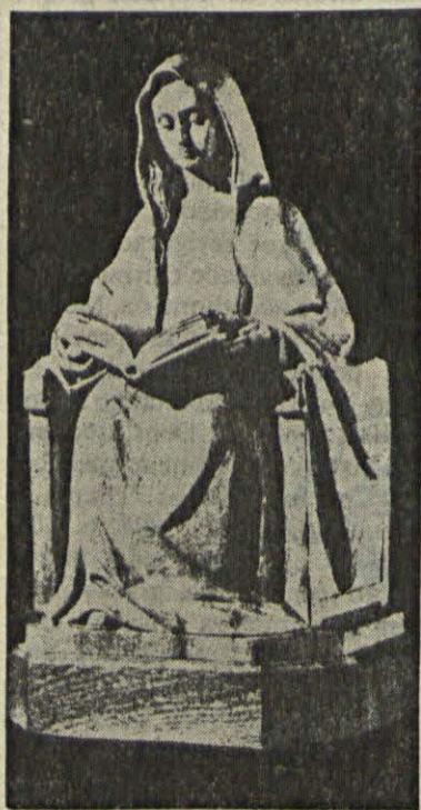
Nossa Senhora do Livro padroeira e símbolo da Biblioteca Mariana de Dayton

Existe em DAYTON, Ohio, Estados Unidos da América, a Biblioteca Mariana mais rica do Mundo. Presentemente possui mais de 60 mil volumes de tema mariano, crescendo ao ritmo de 1.500-2.000 obras por ano.