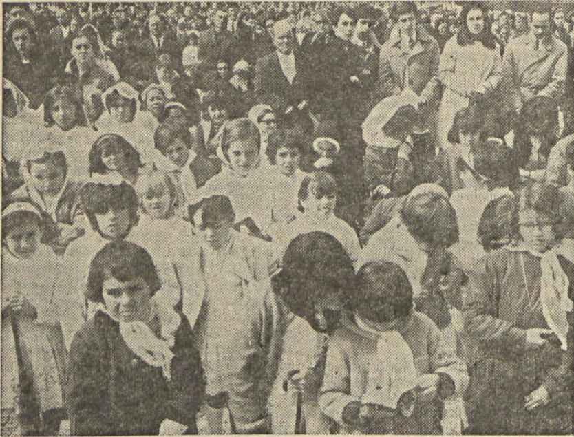
CINQUENTENÁRIO DA MORTE DO FRANCISCO — Várias centenas de crianças, sobretudo da freguesia da Fátima, concentraram-se no Calvário Húngaro para rezar pela Igreja.