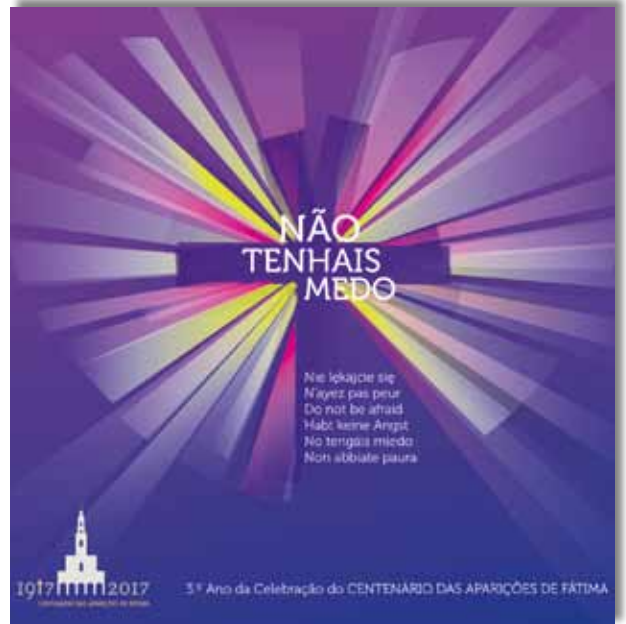
Voici l’affiche qui marque les initiatives de l’année pastorale 2012-2013: “N’ayez pas peur”