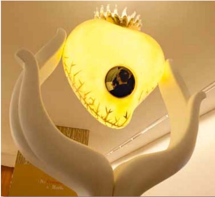
« Au Cœur de Marie » est l'une des trois pièces créées exprès pour cette exposition, par Cristina Rocha Leiria .

Pour célébrer la 3ème Année du Centenaire des Apparitions de Fatima, le Sanctuaire de Fatima inaugure une exposition évocatrice de l'apparition du 13 juin 1917, qui sera ouverte au public du 24 novembre 2012 au 31 octobre 2013