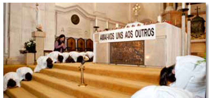
24 novembre 2012, Basilique de Notre-Dame du Rosaire de Fatima/Portugal: « Aimez-vous les uns les autres »

der leurs bénédictions à tous ces enfants, leurs familles, les catéchistes et les enseignants.