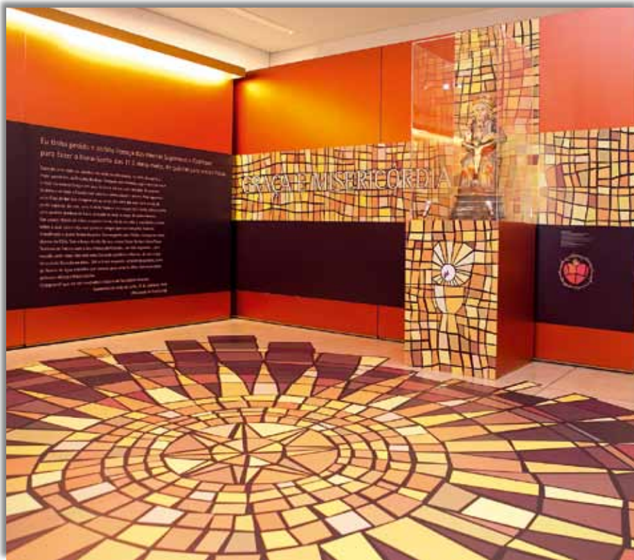
Détail de l'exposition « Dans la trace de la lumière – Les apparitions de Fatima ».