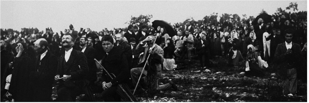
Marienzyklus: Erscheinungen unserer Lieben Frau im Jahr 1917