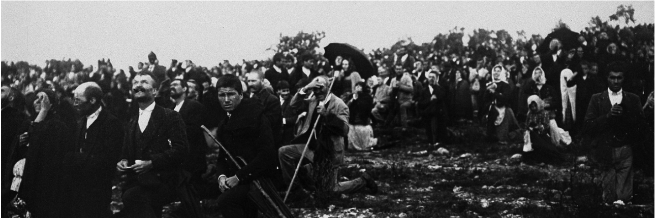
Marienzyklus: Erscheinungen unserer Lieben Frau im Jahr 1917