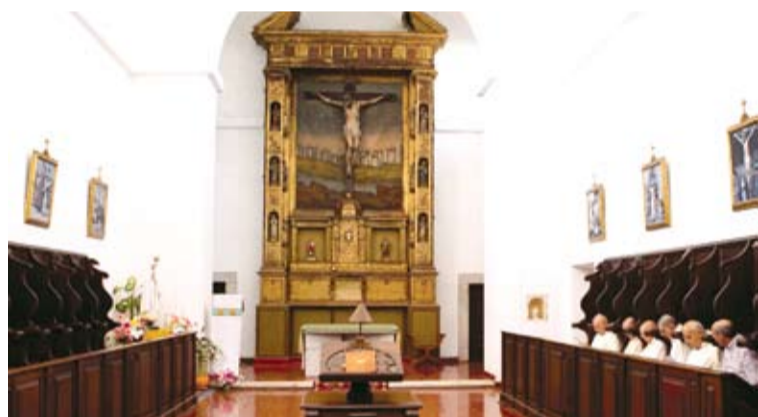
Mosteiro Scala Coeli, Évora