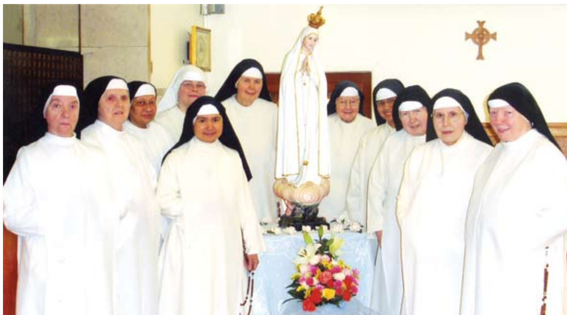
Mosteiro Pio XII, Fátima