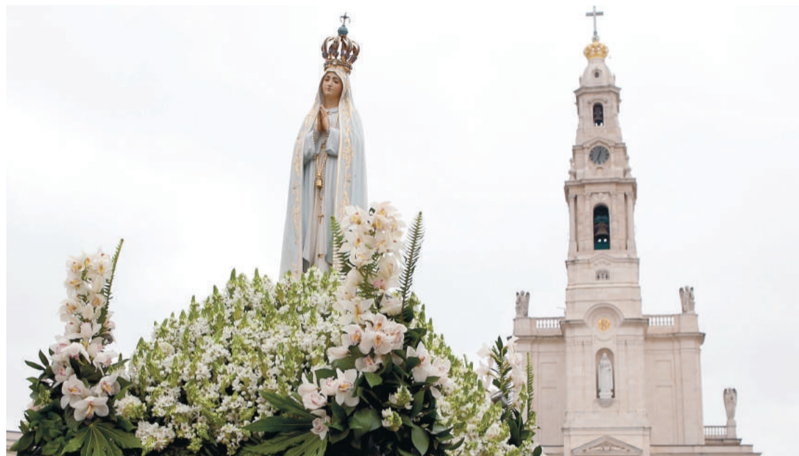
Imagem de Nossa Senhora de Fátima será ícone mariano em Roma