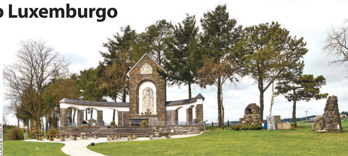
Santuário/Monumento dedicado a Nossa Senhora de Fátima em Wiltz

Para o arcebispo, “uma das peregrinações mais importantes do Luxemburgo é a peregrinação a Nossa Senhora de Fátima, na pequena cidade de Wiltz. Em 1951, foi aí construído um santuário pelos luxemburgueses, que prometeram construí-lo se não perdessem durante a dura Ba-