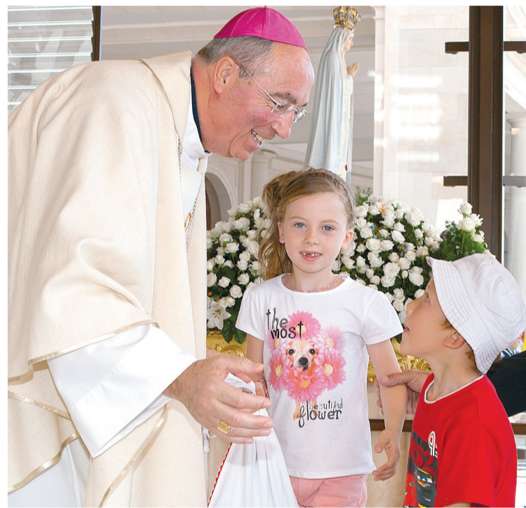
Repetiu-se na peregrinação a tradição da oferta de trigo pelos peregrinos.