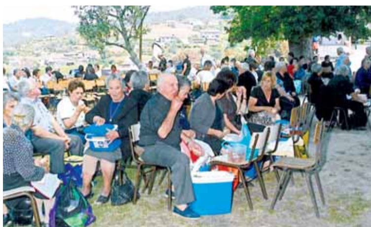
Depois de uma manhã de oração e reflexão, é bom recuperar forças físicas

A consolação dos homens é Deus. De facto, Deus é-nos apresentado na Bíblia sobretudo como Deus de misericórdia e perdão. No livro do Êxodo, Deus diz a Moisés: Eu vi a situação do meu povo e