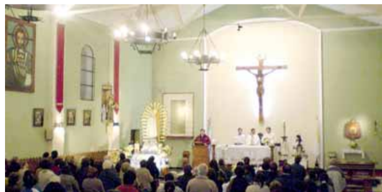
Celebrações em 13 de Maio 2007