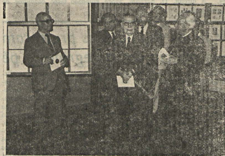
(Continuação da 8.ª página)

do Presidente da Junta de freguesia de Fátima, membros da Comissão Organizadora, diversos expositores, jornalistas, funcionários dos Correios e outros convidados.