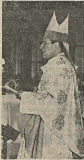
O Sr. Cardeal Patriarca na homilia