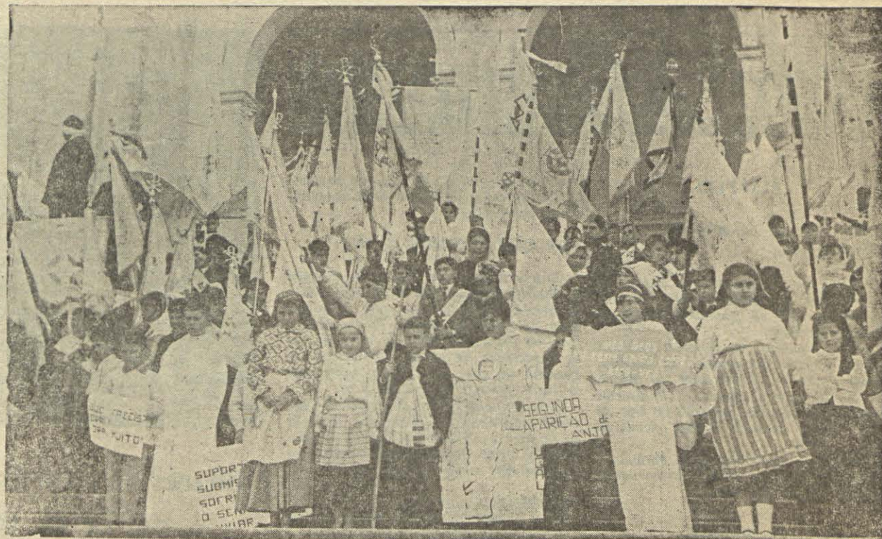
Ainda a peregrinação das crianças à Fátima, no dia 10 de Junho: estandartes, cartazes, bandeiras, alegorias, tudo para ajudar a viver a mensagem do Anjo de Portugal em 1916.